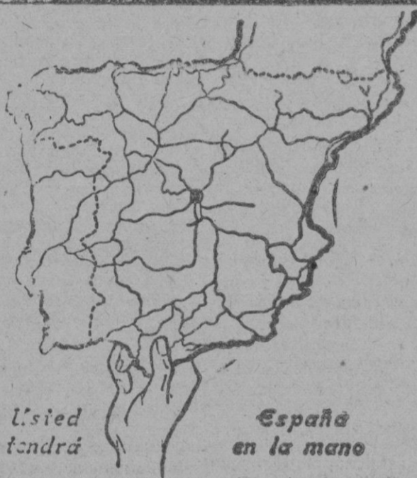
Usted tendrá España en la mano