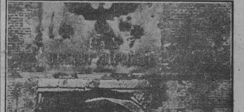
En su reciente visita al frente, Churchill, acompañado por Montgomery y un general norteamericano, sale de un fuerte alemán que ofrece las huellas de la lucha desarrollada por su conquista.