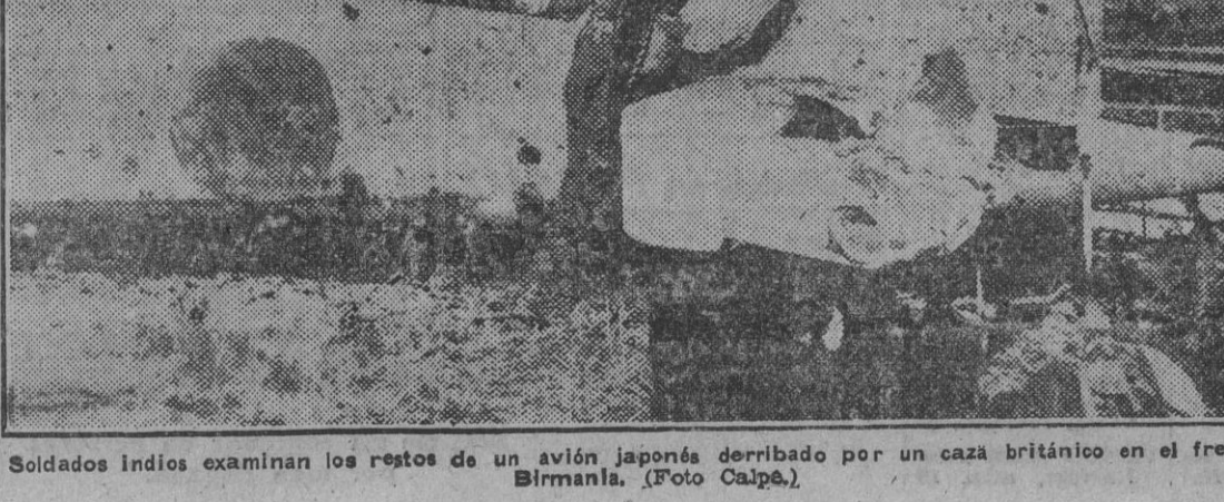
Soldados indios examinan los restos de un avión japonés derribado por un caza británico en el frente de Birmania.