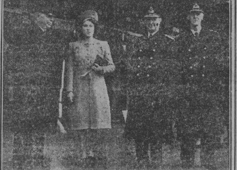
La princesa Isabel de Inglaterra con el primer lord del Almirantazgo y el primer lord del Mar durante la reciente ceremonia naval, en la que fué botado el mayor acorazado inglés construido hasta la fecha.