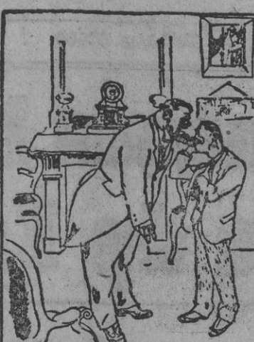
EL SORDO EN CASA DEL ESPEJALISTA