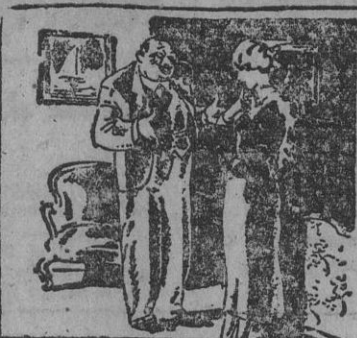
—Pablo ha venido a pedirme tu mano.

¿Qué le pasa, doctor? —Cincoenta pesetas. —¿Cuarenta? —No, Sesenta.