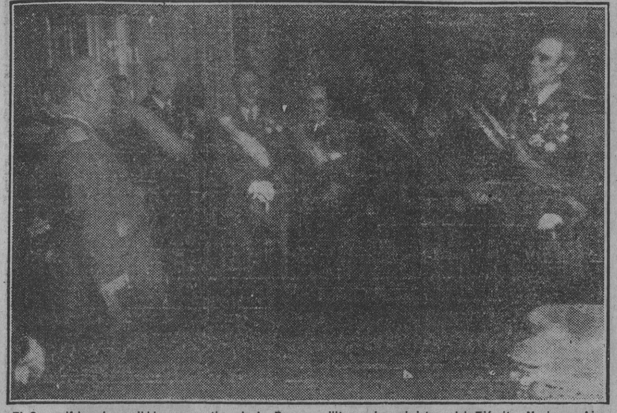
El Generalísimo ha recibido con motivo de la Pascua militar a los ministros del Ejército, Marina y Aire. Recogen el momento en el que el general Asensio pronunció ante Su Excelencia el Jefe del Estado su discurso.

EL MINISTRO DEL EJERCITO Y AUTORIDADES VISITARON A LOS GENERALES MAS ANTIGUOS DE LA ESCALA DE RESERVA