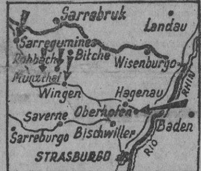
Los alemanes han atravesado el Rin en dirección oeste, por el norte y por el sur de Estrasburgo, según comunican los partes germano y aliado, y han reconquistado numerosas localidades. En el gráfico están señalados los puntos donde, en estos momentos, se lucha intensamente, como Gramsheim y Offendorf.

Las fuerzas alemanas que a ambos lados de Bitche atacan hacia el Sur desde hace días, han conseguido una brecha en el dispositivo aliado, y después de cruzar la línea Magnot—en combates de extraordinaria dureza a los que apenas se han referido las informaciones de ambos beligerantes—han profundizado hasta alcanzar la carretera de Sarreguemines a Haguenau desde el este de Wingen a Meisling. (Continúa en cuarta página.)