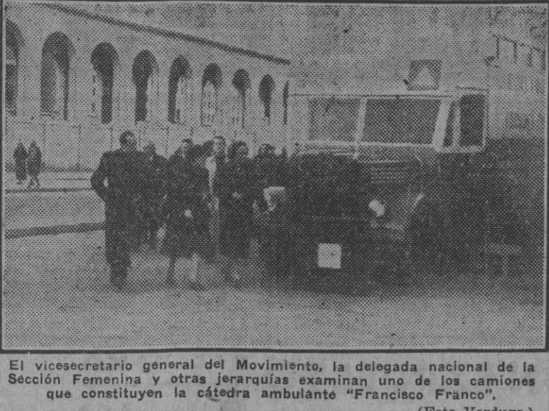
El vicesecretario general del Movimiento, la delegada nacional de la Sección Femenina y otras jerarquías examinando uno de los camiones que constituyen la cátedra ambulante "Francisco Franco".