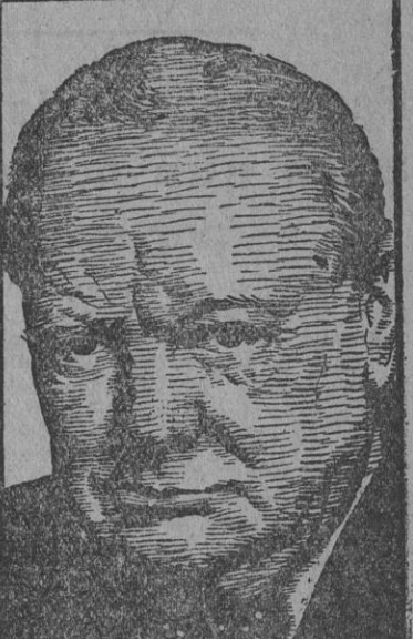
política reaccionaria o de haber impedido la libre expresión de voluntad a los griegos. Al ayudar a los pasajes que han sufrido la ocupación alemana a reanudar la vida normal, libre y democrática que desearán, el tratado de consiguiente por todos los medios posibles en cuanto dependa de esta Cámara." (Efe.)

Publicado en nuestro número de ayer el extracto de las manifestaciones fundamentales contenidas en el discurso que el primer ministro británico pronunció en el debate que sobre la situación de Grecia se planteó en los Comunes, damos a continuación una síntesis de los demás conceptos expuestos por Churchill, que consideramos de interés, dada la trascendencia de la enérgica intervención, que dió al "premier", una vez más, la confianza de la Cámara.