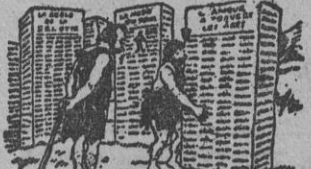
SIGILO DE GUERRA