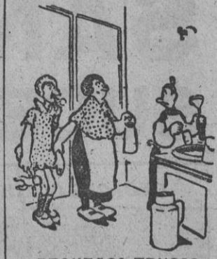
PEQUEÑOS TRUCOS - ¿Quieres un libro de che para mí?