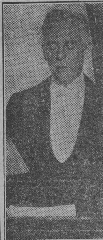
Georges Claude, químico y físico francés, miembro de la Academia de Ciencias...