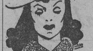
MODELO DE ENORME ACEPTACION PARA ESTAS NAVIDADES