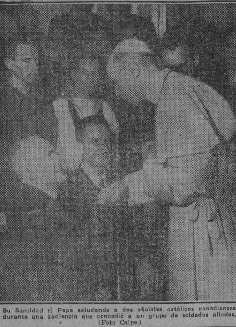
Su Santidad el Papa saludando a dos oficiales católicos canadienses durante una audiencia que concedió a un grupo de soldados aliados.