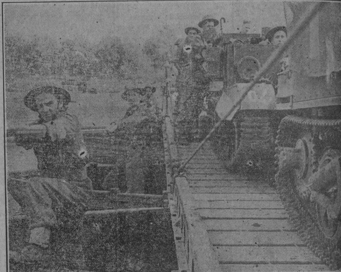
Fuerzas de ingenieros británicos han montado rápidamente un puente, y una sección del octavo ejército cruzó el río para establecer cabezas de puente que faciliten el paso a las demás tropas.