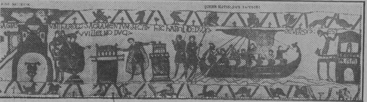
Harold, duque de Inglaterra, jura fidelidad a Guillermo de Normandía.

Eduardo, Rey de Inglaterra, constructor de la abadía de Westminster, considera el porvenir con mirada cargada de inquietud por los peligros que se ciernen sobre él. Los vikings y los dancis se arman para ir a las expediciones guerreras; el Rey no ha sabido dominar las sublevaciones en el interior. Sólo lo sabe un hombre que a través de infinitas dificultades se ha elevado sobre los demás: Guillermo de Normandía. Este envía un mensajero a Harold, duque de Inglaterra. Guillermo casa a Harold con su hija. Este presta solemne juramento de fidelidad en Bayeux. Los lazos de parentesco, la fraternidad de armas forman la base de un seguro porvenir, y el duque de Inglaterra regresa a sus dominios. Pronto muere el Rey, mas apenas se habían terminado los funerales cuando Harold, apoyado por el