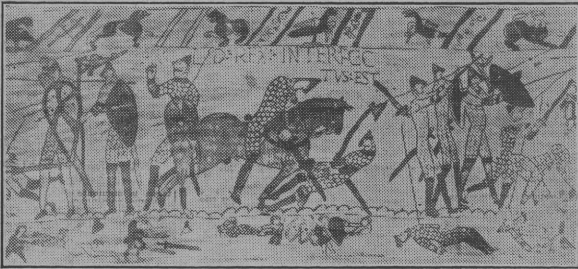
La escena representa el momento en que Harold muere en acción de guerra derrotado por los normandos.