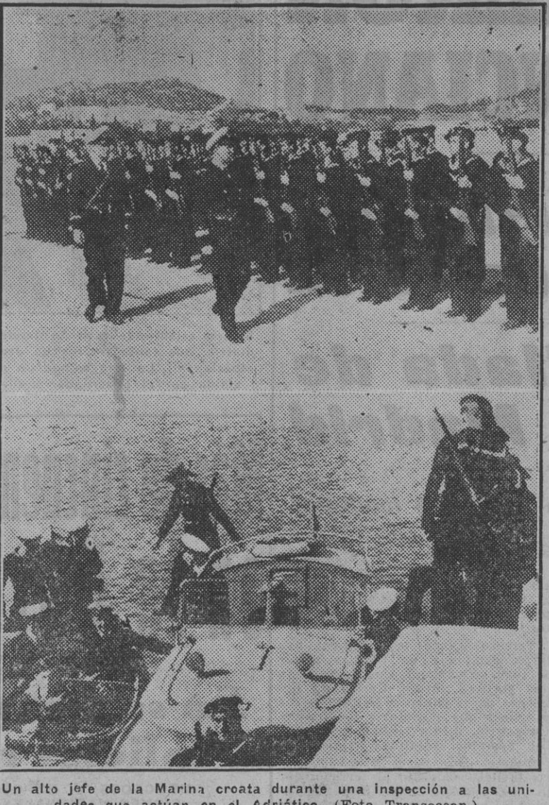
Un alto jefe de la Marina croata durante una inspección a las unidades que actúan en el Adriático.