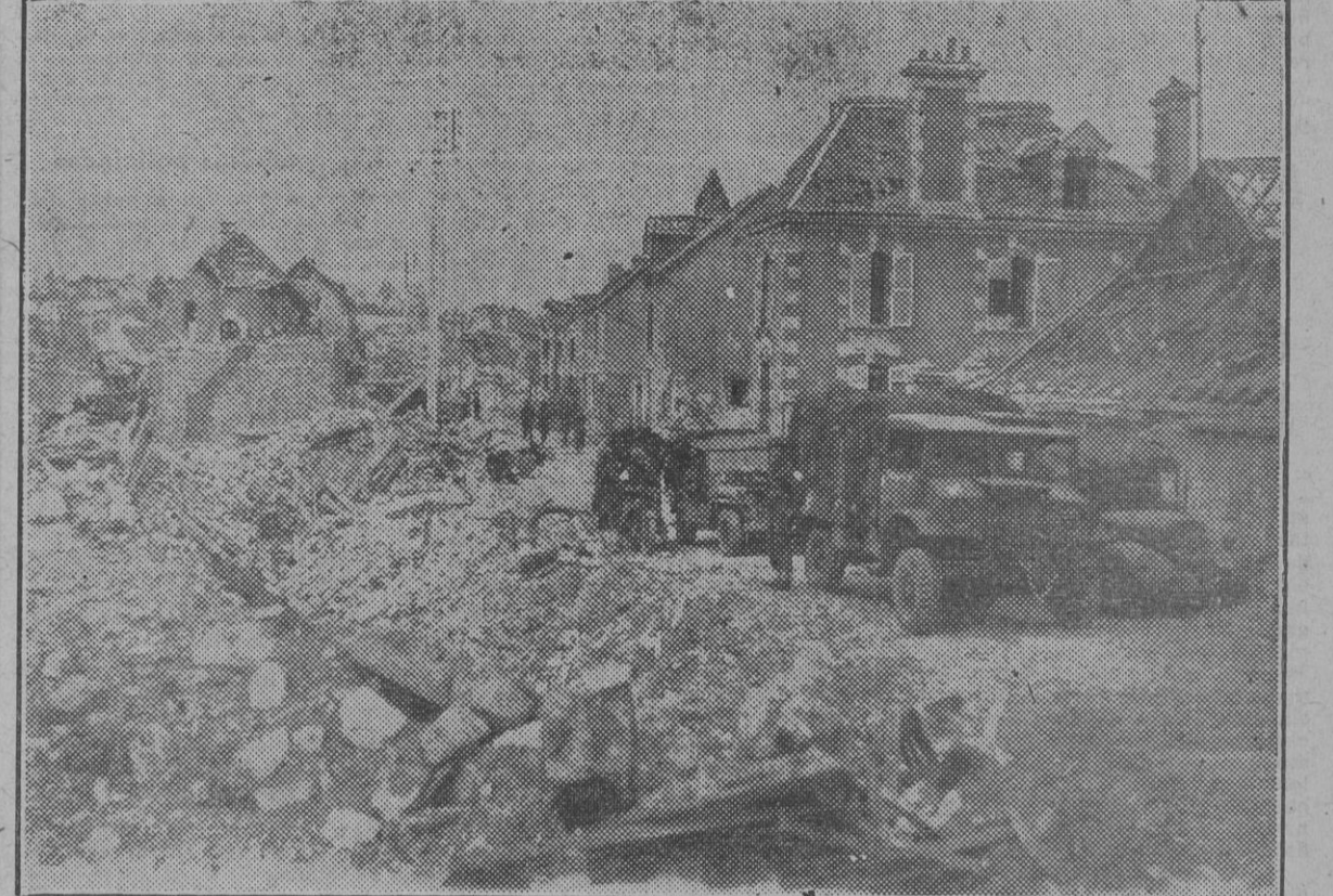
Por las calles destruidas de Caen pasan continuamente vehículos y tropas británicas en dirección al frente.