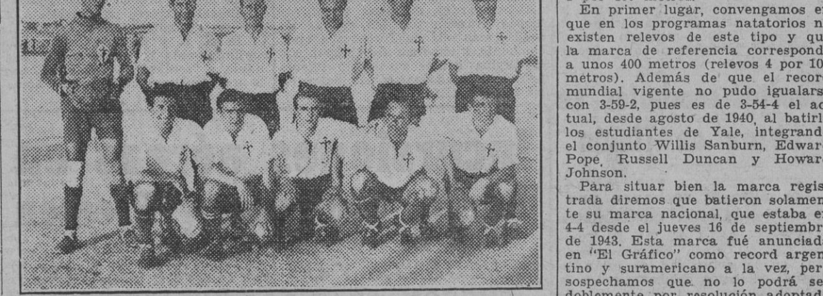
Selección de populares figuras actuales y antiguas que ayer jugó contra un conjunto regional en el campo de la Guindalera con motivo de la festividad del Apóstol Santiago.