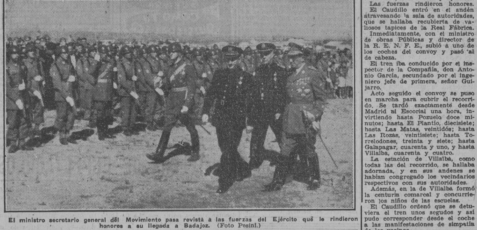
El ministro secretario general del Movimiento pasa revista a las fuerzas del Ejército que le rindieron honores a su llegada a Badajoz.