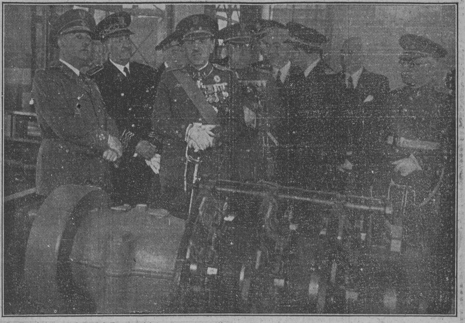
Su Excelencia el Jefe del Estado visitó esta mañana diversas instalaciones de la nueva línea electrificada Madrid-Escorial-Cercedilla. La fotografía recoge un momento de la visita del Caudillo a una de las aludidas instalaciones.