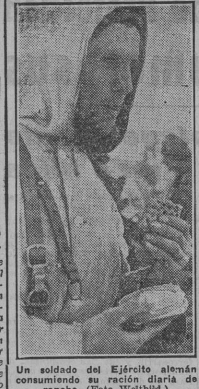
Un soldado del Ejército alemán consumiendo su ración diaria de rancho.