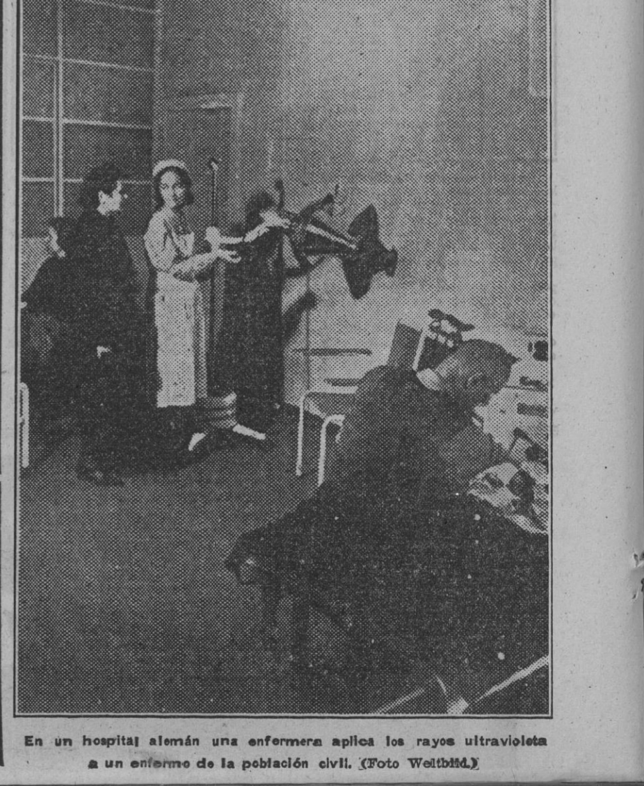
En un hospital alemán una enfermera aplica los rayos ultravioleta a un enfermo de la población civil.