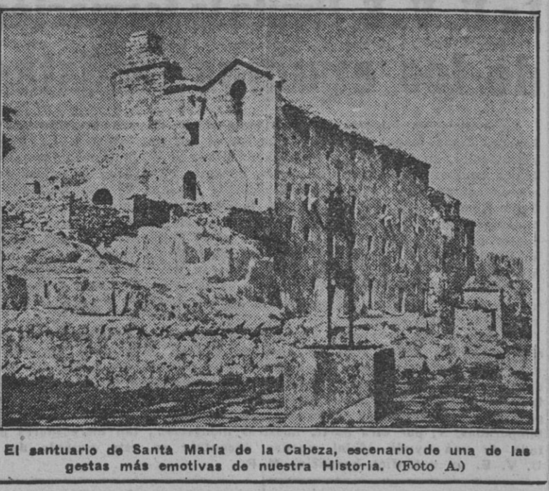
El santuario de Santa María de la Cabeza, escenario de una de las gestas más emotivas de nuestra Historia.