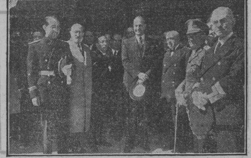
El ministro de la Gobernación, camarada Blas Pérez González; el director general de Correos y Telecomunicación, camarada De Miguel; el director general de Seguridad, señor Rodríguez Martínez, y otras personalidades a la salida de la función religiosa celebrada en San Francisco el Grande.

Se celebraron diversos actos presididos por el ministro de la Gobernación