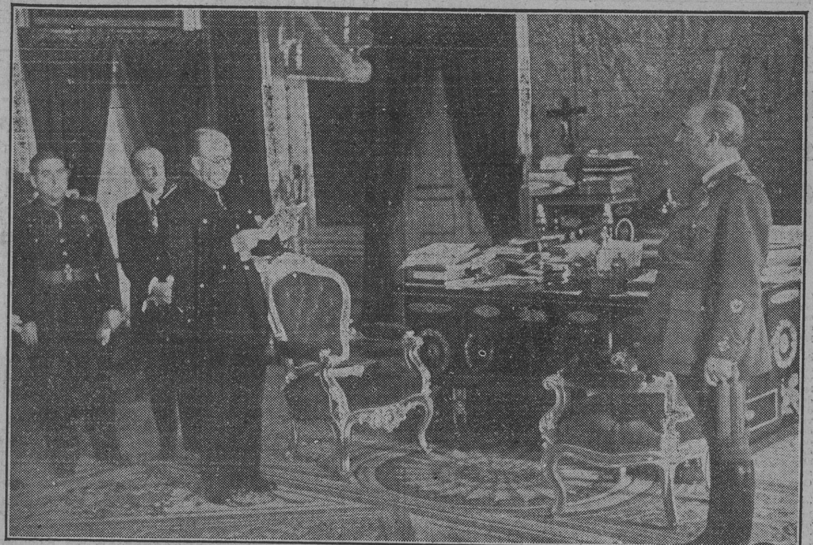
El alcalde de Madrid, don Alberto Alcocer, lee su discurso ante el Jefe del Estado en la visita que esta mañana realizó la Comisión Municipal a Su Excelencia con motivo del quinto aniversario de la liberación de la capital.