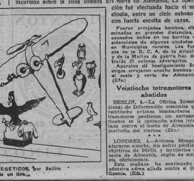
TROFEOS CINEGETICOS por Bellón

Por los que se empeñan en creer que esa doctrina primitiva, nacida en la impaciencia de una Patria en almoneda, tenía, al ser proclamada, la zanía de la provisión y hasta la gracia genial capaz de despertar a su paso la más encendida controversia, pero no la meditada seriedad de lo permanente; y por los que, reconociendo la virtud de nuestros principios, la inalterable verdad histórica de la Patria que nosotros buscamos, creen en cambio que el tiempo no nos es propicio y que, como las circunstancias mandan, debemos ir pensando en la conveniencia de revisar posturas para hacer más cortas las distancias.