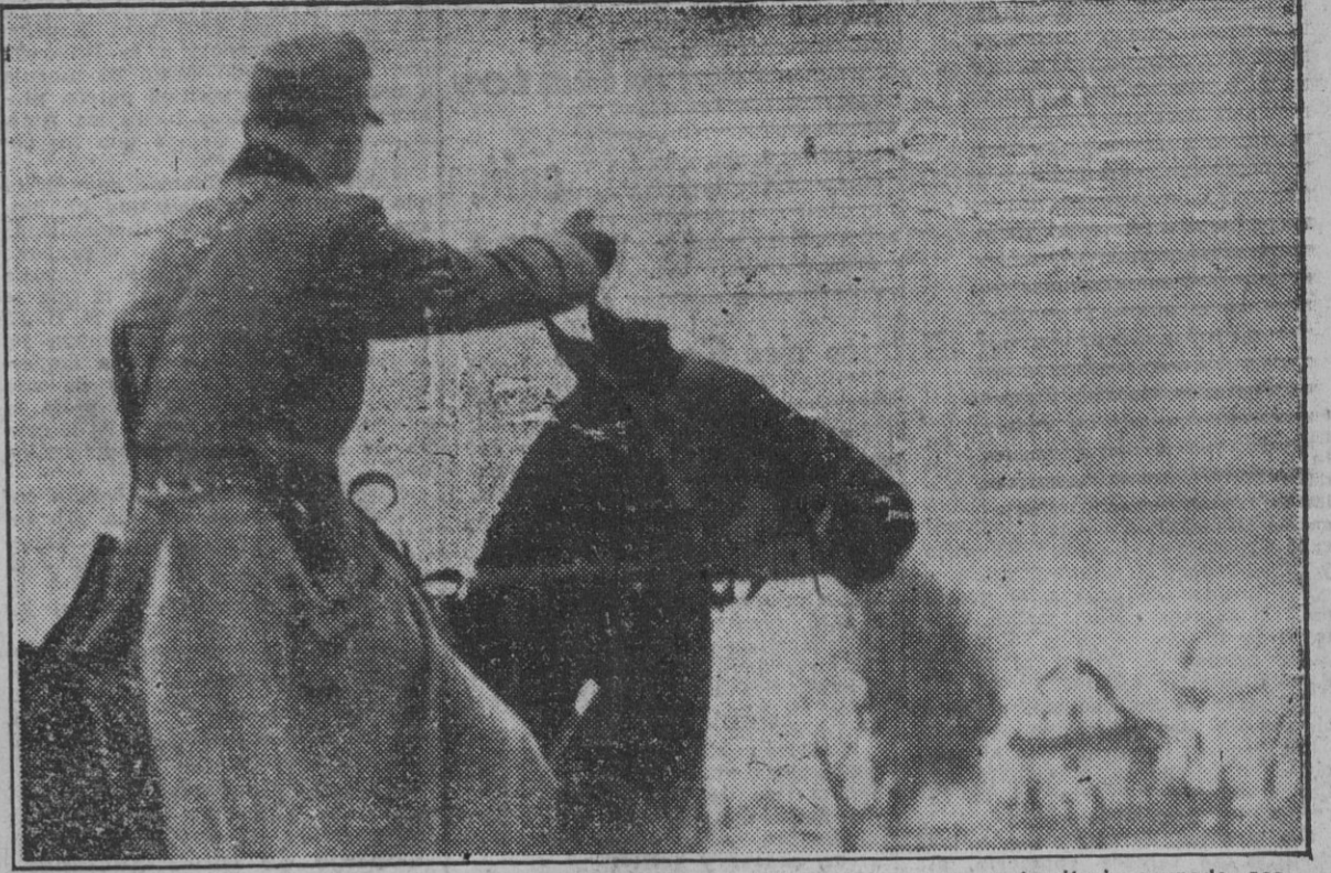
La Policía alemana lucha intensamente contra las bandas soviéticas que operan en territorio ocupado, ocasionando toda clase de desmanes, como puede apreciarse por el fuego producido en granjas avícolas, que es rápidamente sofocado por aquélla.