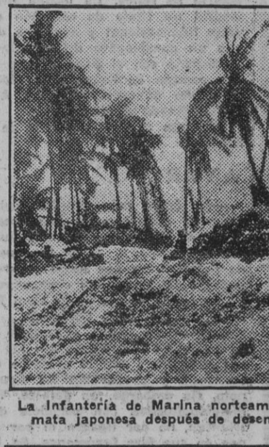
La infantería de Marina norteamericana toma a la carga una casamata japonesa después de desembarcar en una playa de Tarawa.