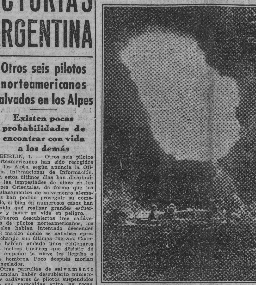
Grandes cañones defendían la costa atlántica dominada por las tropas del Reich. La fotografía recoge el efecto luminoso de un disparo en la noche.