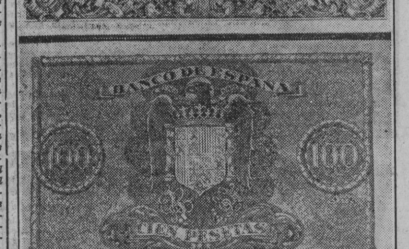
Anverso y reverso de los nuevos billetes de 100 pesetas que en breve serán puestos a la circulación.