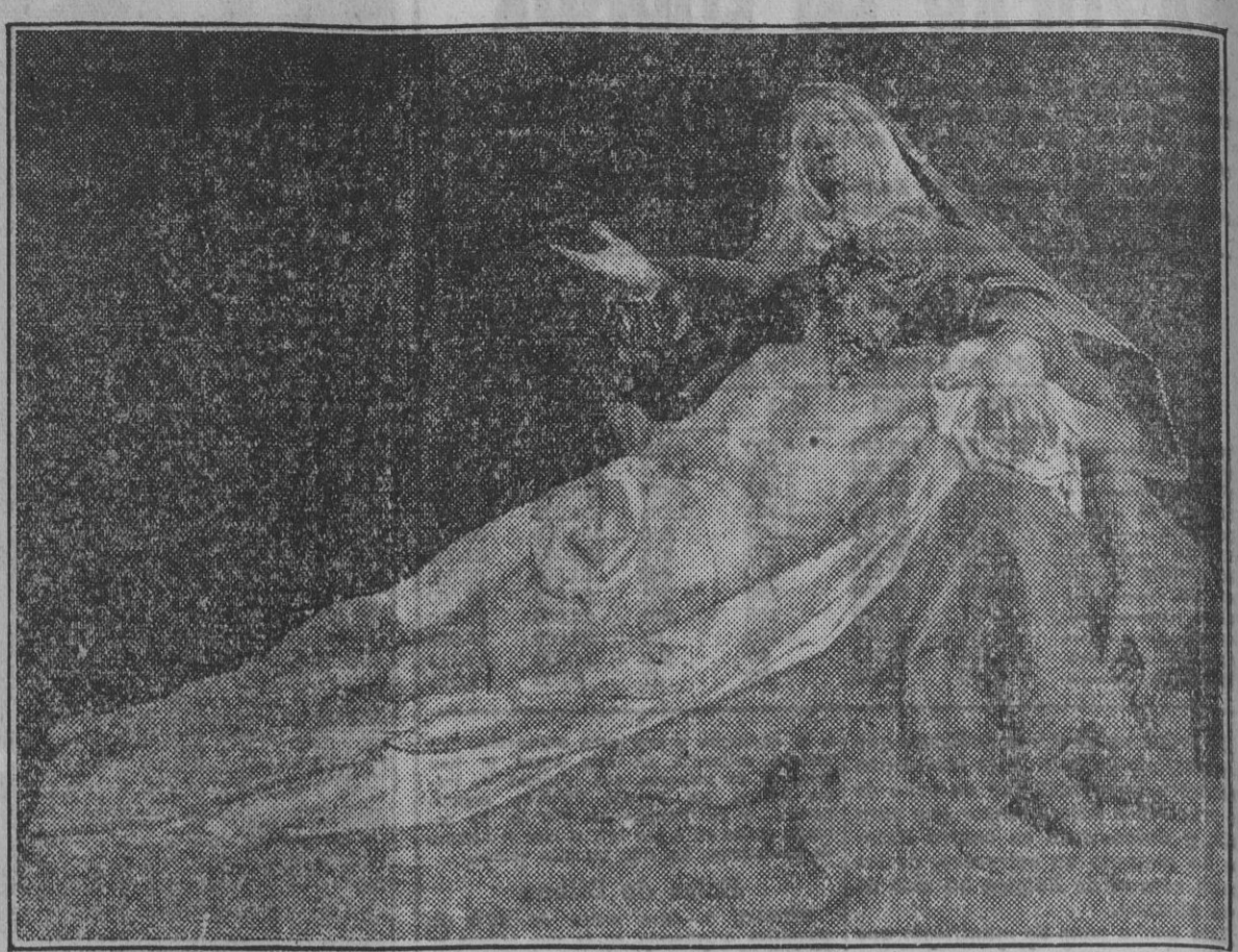
"PIEDAD", DE GREGORIO HERNANDEZ.

No es el está lo suficientemente extendida por España la verdad de la riqueza artística que guarda Valladolid. Seguramente que fuera de quienes viven entregados a la afición de contemplar la plástica del sentir de un pueblo, muy pocos son los que tengan conocimiento de la existencia de una de las fuentes fundamentales para el estudio del arte escultórico.