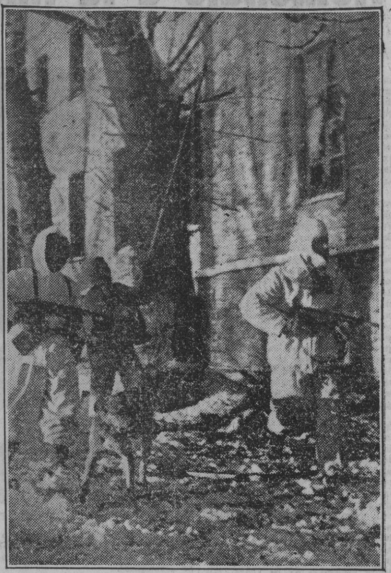
Enmascarados con blancos uniformes y fuertemente armados con fusiles automáticos, estos soldados de vanguardia penetran en una población soviética defendida casa por casa...