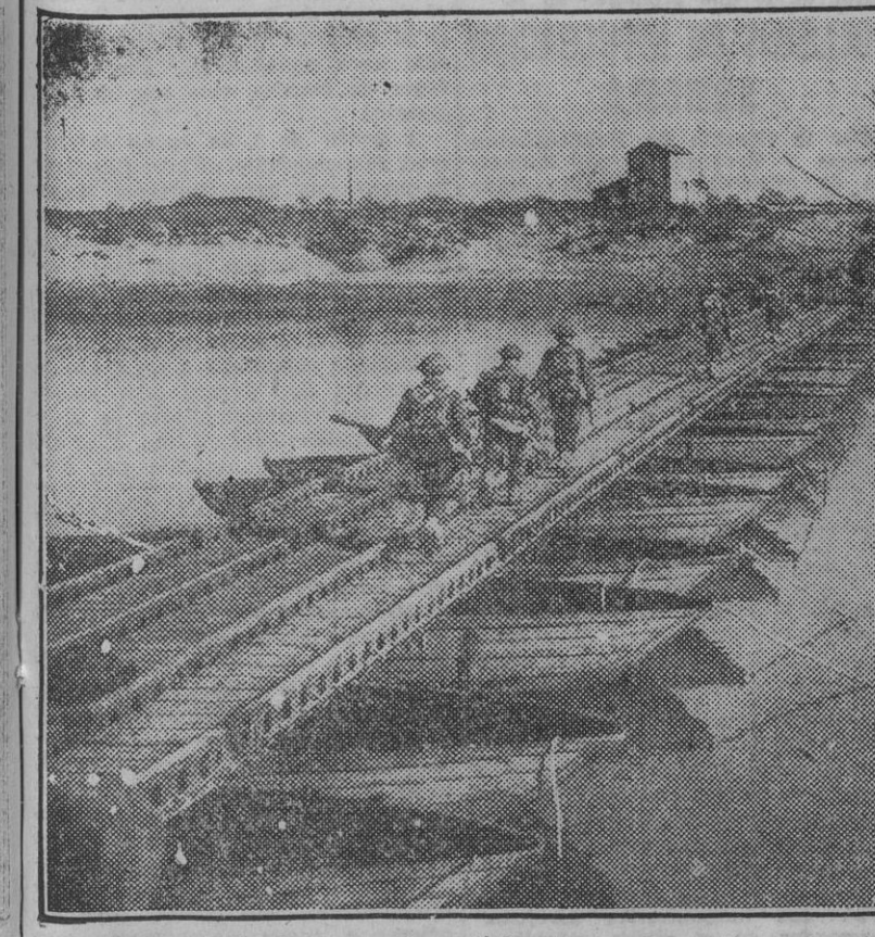
La intantería británica cruza el Garelano sobre un puente que acaban de construir los pontoneros.