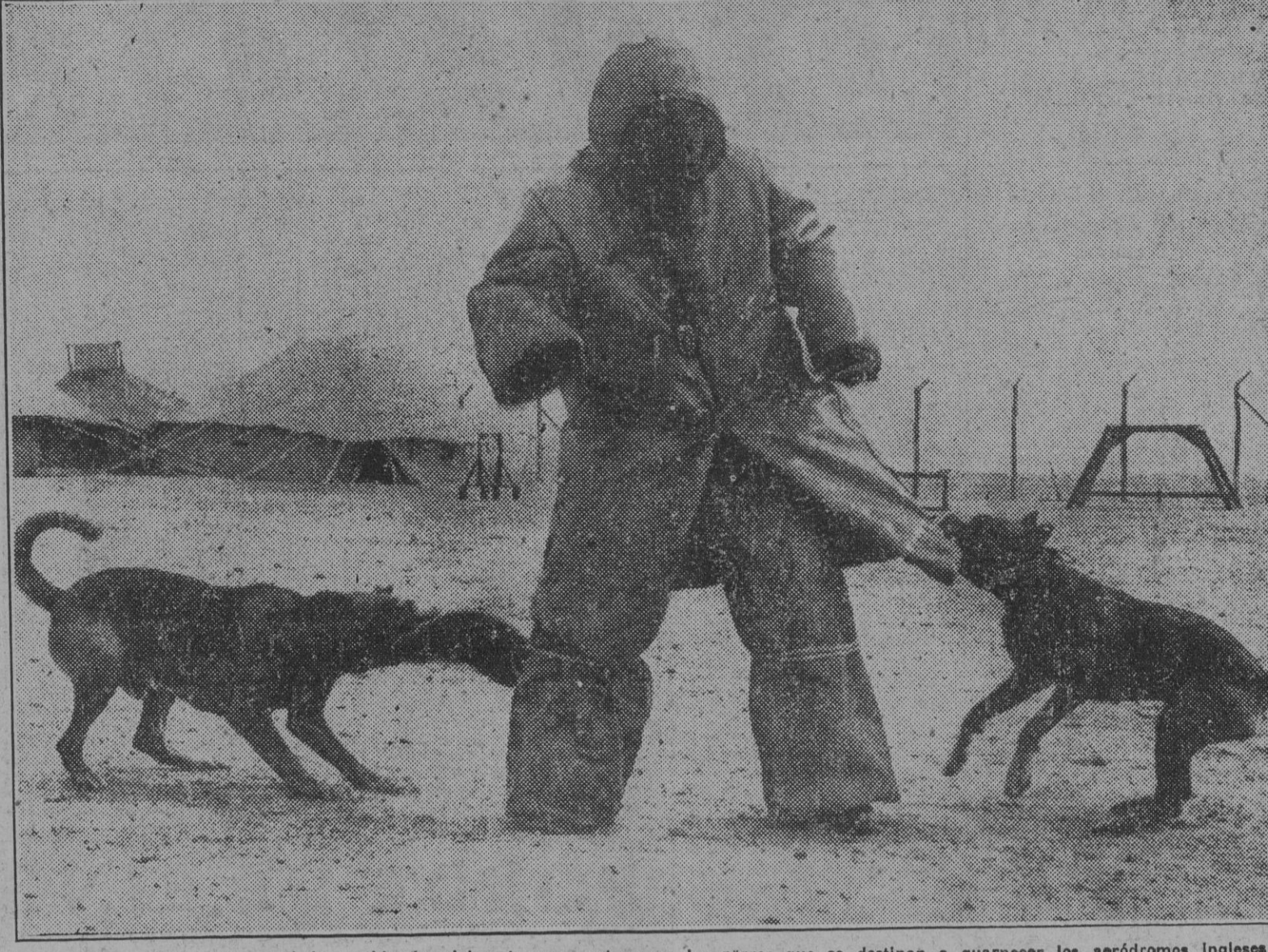
Dos mastines atacan a un soldado vestido especialmente para entrenar a los perros que se destinan a guarnecer los aeródromos ingleses en el Oriente Medio.