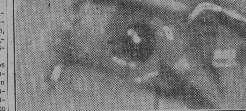
Apenas hecho el injerto de la córnea, ya presentaba el ojo este otro aspecto brillante y normal.

Se extiende el doctor en consideraciones que, a pesar de ser expuestas con suma claridad, escapan un tanto a nuestros escasos conocimientos científicos o, por lo que nos abstenemos de reproducirlas. Limitamos el interés del lector a que sepa que no es