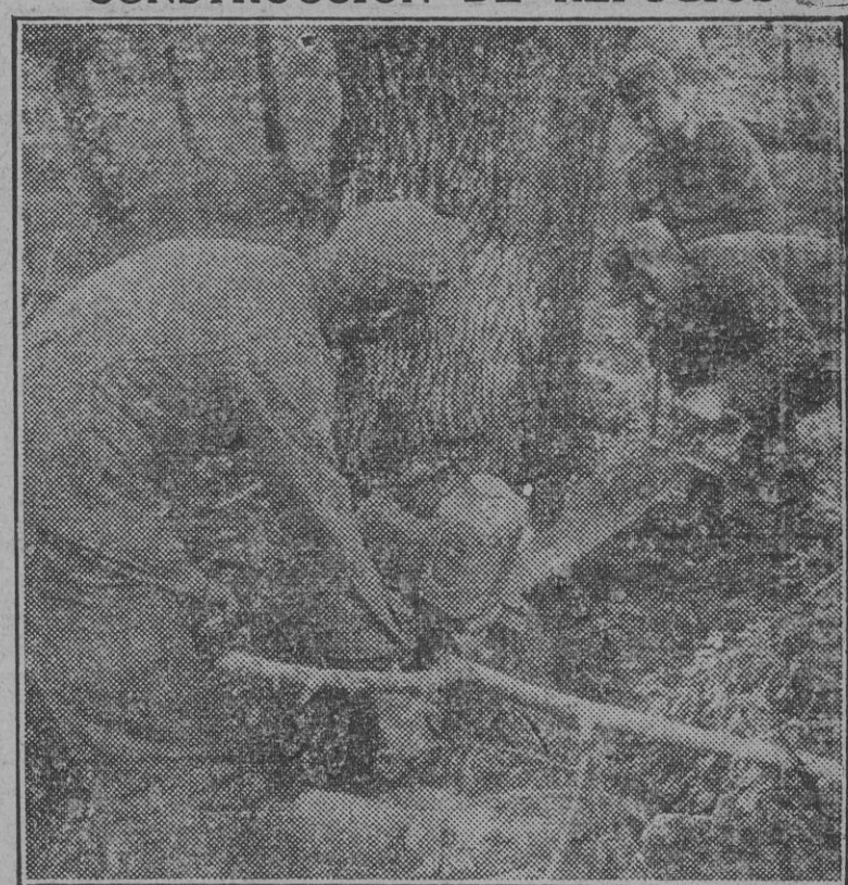
Soldados alemanes proceden a serrar un árbol para la construcción de un refugio en un sector del frente italiano.