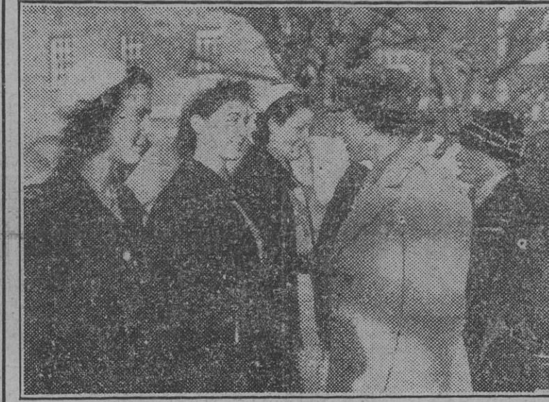
La princesa real de Inglaterra, hablando con unas enfermeras de un hospital naval durante una visita de inspección.