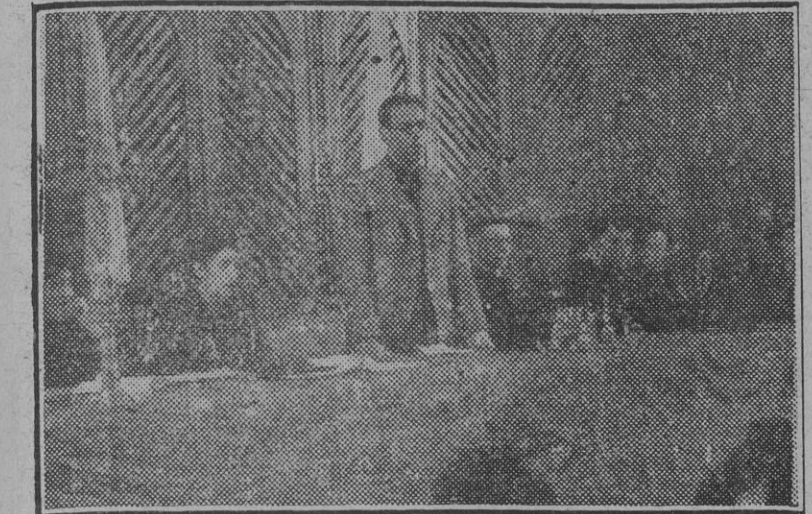
El consejero nacional camarada Tovar durante su brillante disertación ante el VIII Consejo Nacional de la Sección Femenina.

Interesante conferencia del camarada Fernando María Castiella