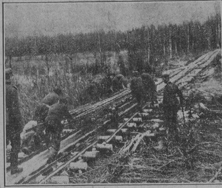
Ingenieros alemanes tienden una línea ferroviaria hacia el frente en un sector del Este.