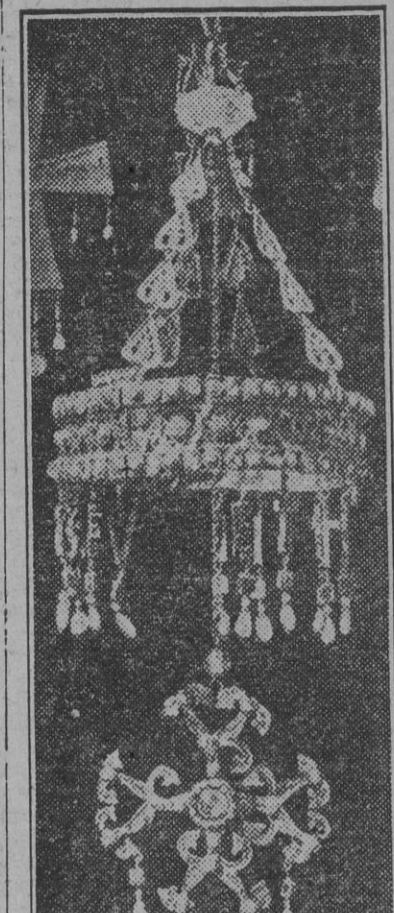
La joya más preciada del tesoro de Guarrazar era la corona votiva de Suintila, robada en 1921 de la Armería Real.

No se trata de coronas, en el estricto sentido de constituir un objeto