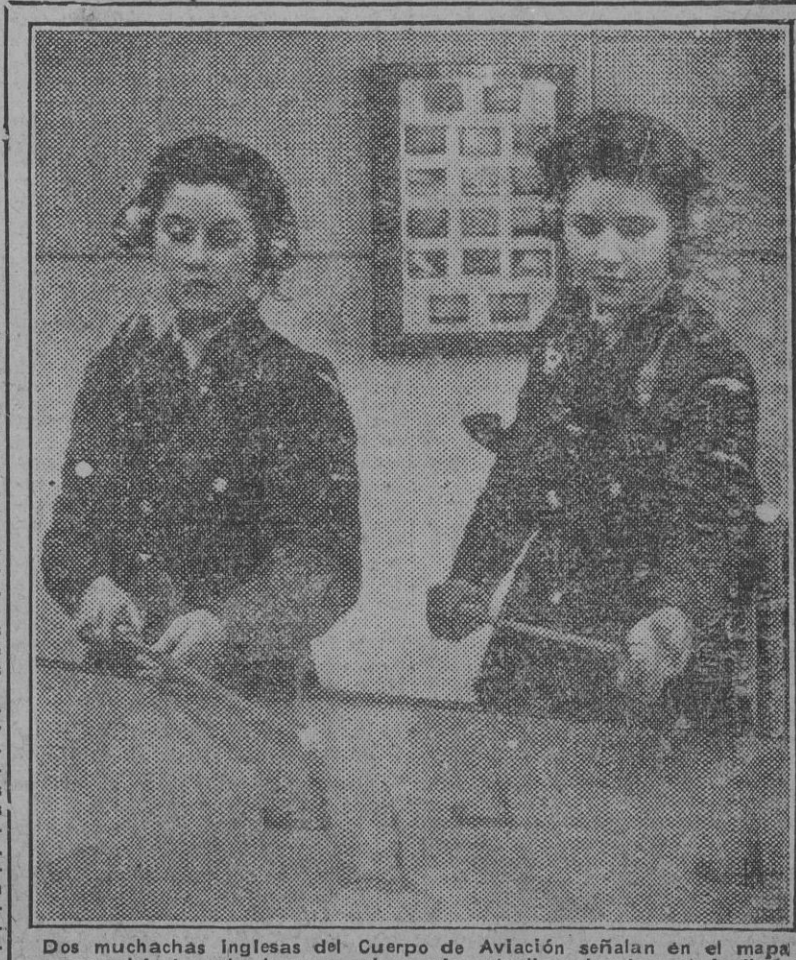
Das muchas Inglesas del Cuerpo de Aviación señalan en el mapa especial el vuelo de unos aviones de patrulla sobre la metrópoli.

Añade el corresponsal que en el momento no es posible hacerse una idea sobre las intenciones del Mando aliado, dadas las precauciones que adopta, aunque se supone que su propósito es seguir desembarcando tropas y material de guerra inintermitentemente. Pero con esto no podrá impedir que en las próximas horas y días surjan pérdidas importantes en su estrecha cabeza de puente. Tampoco se verán realizadas sus esperanzas de que el Mando alemán retire fuerzas del frente de Cassino para atender a este nuevo sector de lucha. (Efe.)