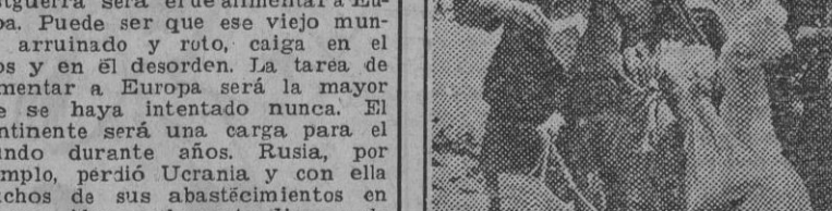
La población indígena de Mezy-el-Bab acude para surtir de combustible a un depósito instalado por las fuerzas norteamericanas.