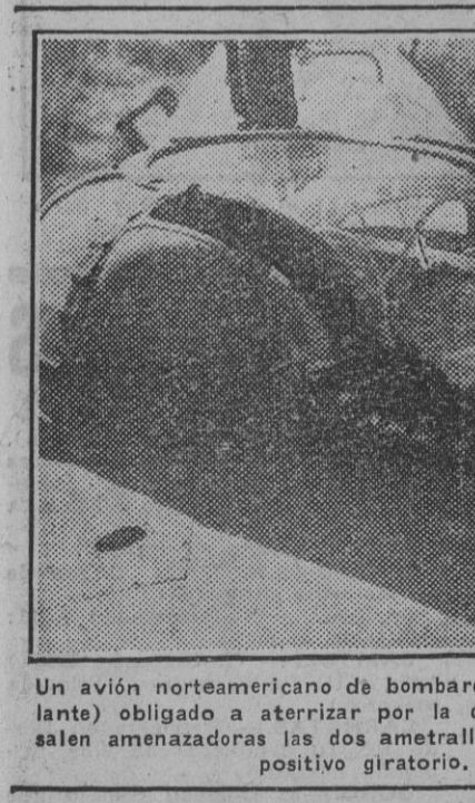
Un avión norteamericano de bombardeo tipo Boeing B-29 (fortaleza volante) obligado a aterrizar por la densa niebla. De la carlinga salen amenazadoras las dos ametralladoras pesadas colocadas en dispositivo giratorio.

El Generalísimo abandona la Catedral y la multitud renueva los vitores y aclamaciones de entusiasmo. Seguidamente el Jefe del Estado abandonó el templo catedralicio por la Puerta de la Platería, ante la que se había congregado tal cantidad de personas que hacían imposible la salida y el tránsito de Su Excelencia. Se renovaron entonces los vitores y aclamaciones, y los gritos de "¡Franco! ¡Franco!" y "¡Arriba España!" no cesaron un momento. El Generalísimo fué allí despedido por el prelado, autoridades, jefes militares y demás personalidades y presentaciones citadas, y siguió viaje, acompañado de su esposa e hija y séquito, con dirección a Pontevedra, Vigo y Santa Fe de Indulgencia.