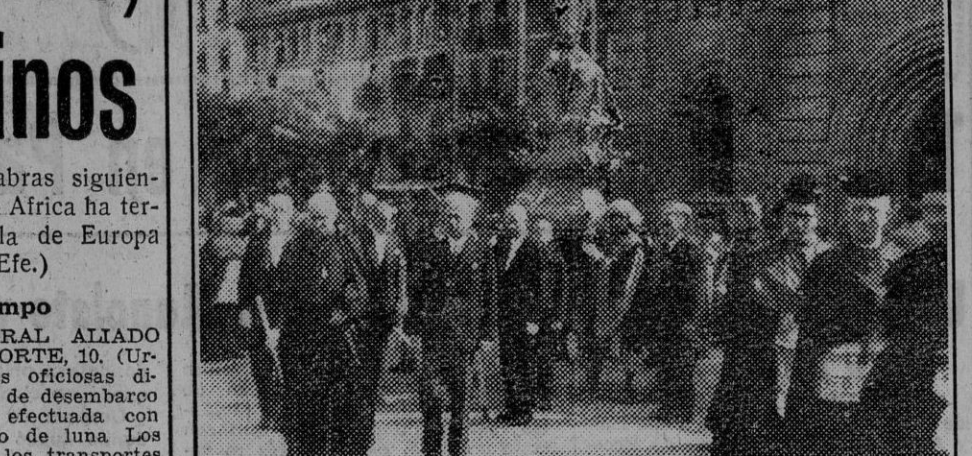
Durante las tradicionales fiestas en Navarra, la procesion de San Fermin recorre las calles de la ciudad, presenciando su paso numerosos fieles. (Foto Reléjox).