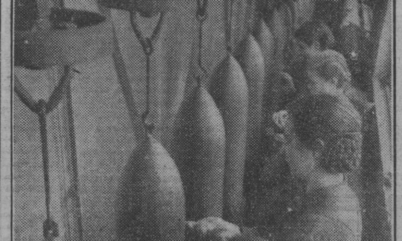
La incorporación de la mujer a los trabajos bélicos ofrece esta muestra de laboriosidad encauzada en el mejor servicio. Se trata de una fábrica de bombas de aviación, donde los últimos detalles están a cargo del personal femenino. (Foto Weltbild.)

NUEVA YORK, 12.—La Prensa relata la odisea vivida por tres marineros de la dotación de un barco mercante norteamericano, que, después de haber permanecido 83 días navegando a la deriva sobre una balsa en aguas del Atlántico Sur. Dos de estos naufragos son holandeses y uno norteamericano. Los naufragos vivieron de la pesca y del agua de lluvia, y las enormes privaciones sufridas, quitaron la vida a otros dos marineros norteamericanos que también se habían salvado en la misma balsa. Los supervivientes, extraviados, fueron recogidos por un guardacostas brasileño. Los naufragos recorrieron en tan deplorables condiciones 1.800 millas. (Efe.)