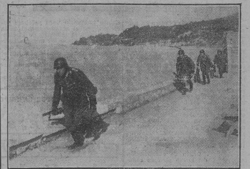
Las fuerzas alemanas que ocupan desde noviembre la costa mediterránea de Francia para prevenir cualquier invasión realizan frecuentes ejercicios con el fin de hallarse constantemente en pie de guerra. Esta fotografía recoge una fase de las maniobras de vigilancia efectuadas en las nuevas fortificaciones construidas en Marsella.