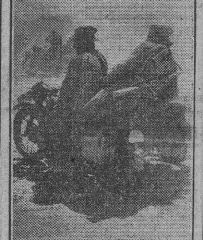
La dureza de la guerra en el desierto reviste caracteres de alto dramatismo. No sólo los combates violentos que allí libran las tropas, sino la lucha contra las tempestades de arena sometidas a las tropas a mil padecimientos y torturas.