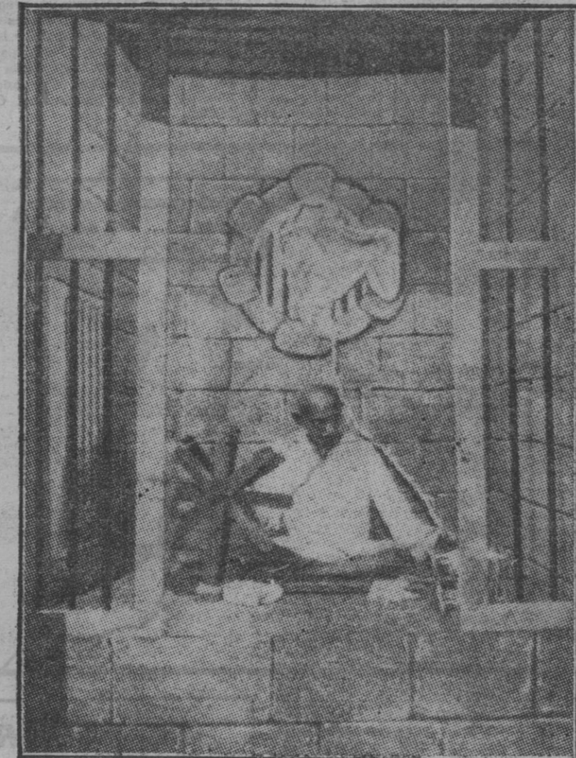
Gandhi, trabajando en su rucsa.

Está preso en la cárcel más lujosa del Mundo