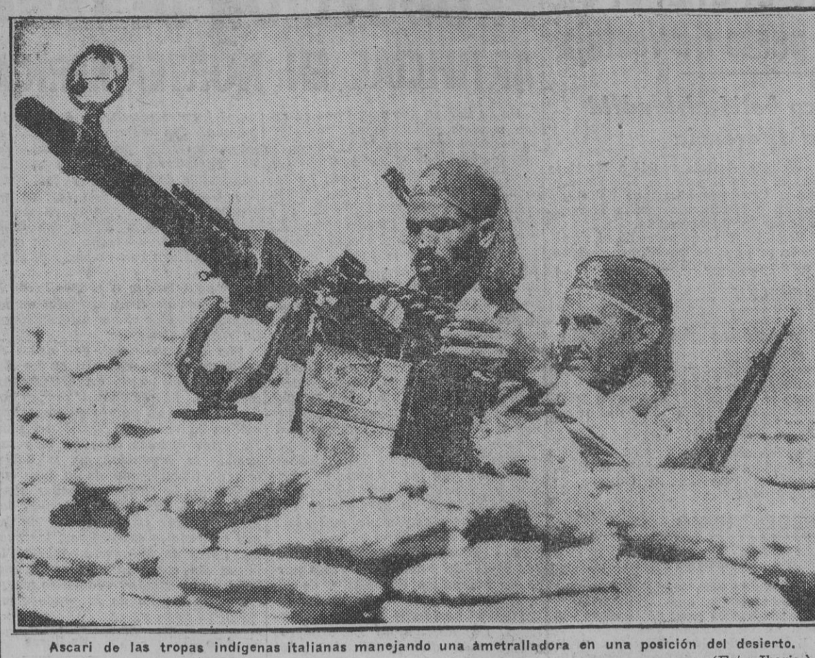
Ascani de las tropas indígenas italianas manejando una ametralladora en una posición del desierto.