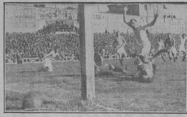
Le llegó el balón en posición difícil al delantero del Madrid; pero Alday aseguró el disparo por bajo, y Bermúdez no pudo nada ante su dureza. Dos-uno a favor y la esperanza de un segundo tiempo por delante. Pero nunca segundas partes fueron buenas.

Equipos: Celta.—Bermúdez; Cons, Deva; Alvarito, Fuentes, Trujillo; Venancio, Mundo, Del Pino, Agustín y Roig. Madrid.—Esquivia; Clemente, Arzangui; Sauto, Ipiña, Huet; Alsúa, Alonso, Alday, Belmar y Botella. José M.ª UBEDA