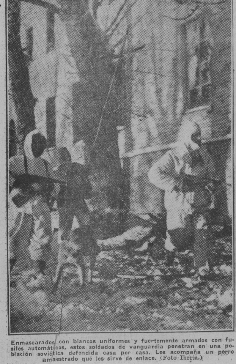
Enmascarados con blancos uniformes y fuertemente armados con fusiles automáticos, estos soldados de vanguardia penetran en una población soviética defendida casa por casa. Les acompaña un perro amaestrado que les sirve de enlace.