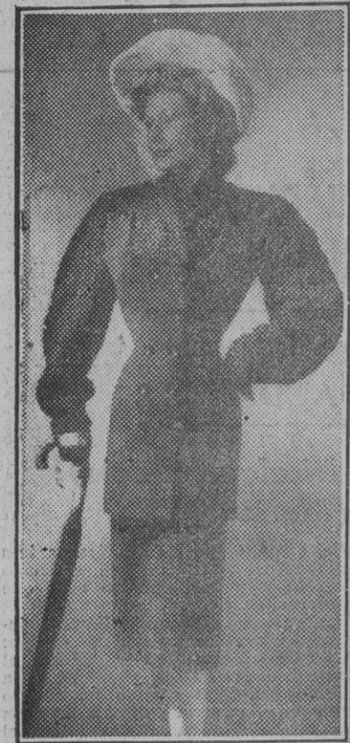
Preciosa chaqueta de astracán y lana negra con doble hilera de botones. Sombrero blanco con un leve tui de nudos negros.