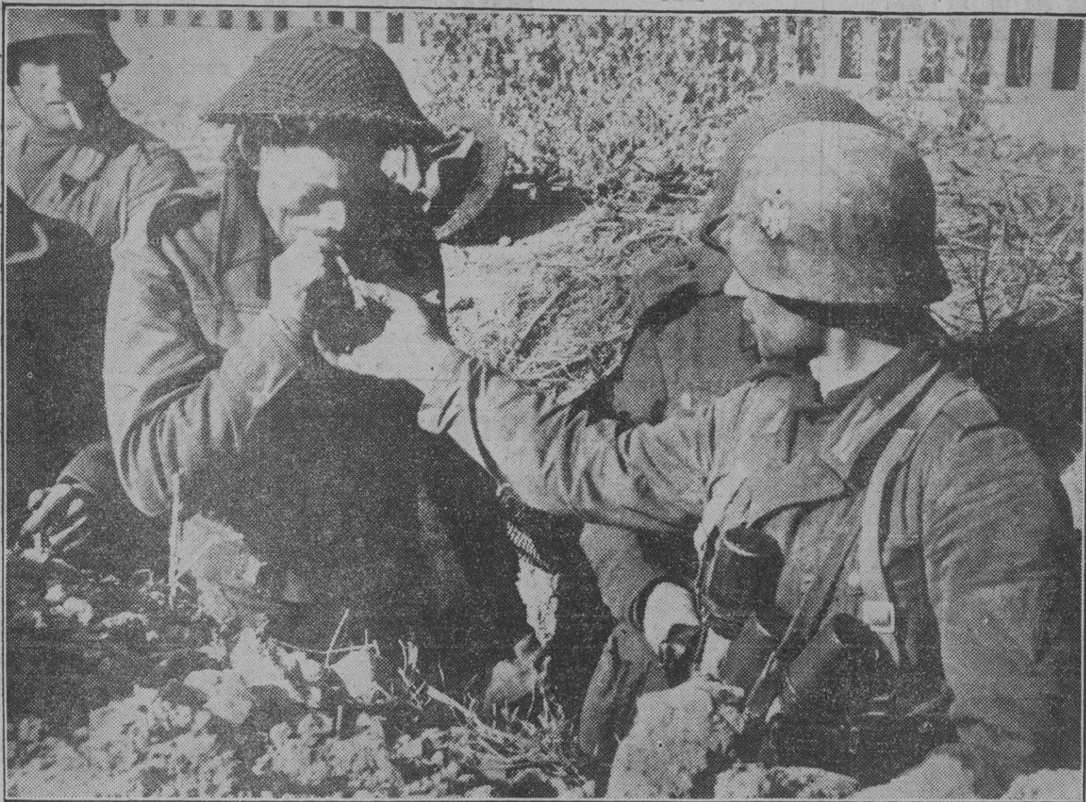
En el frente de combate, pasados los duros momentos de la lucha, los soldados se ayudan unos a otros. Un combatiente alemán da fuego a un soldado enemigo hecho prisionero pocos momentos antes.