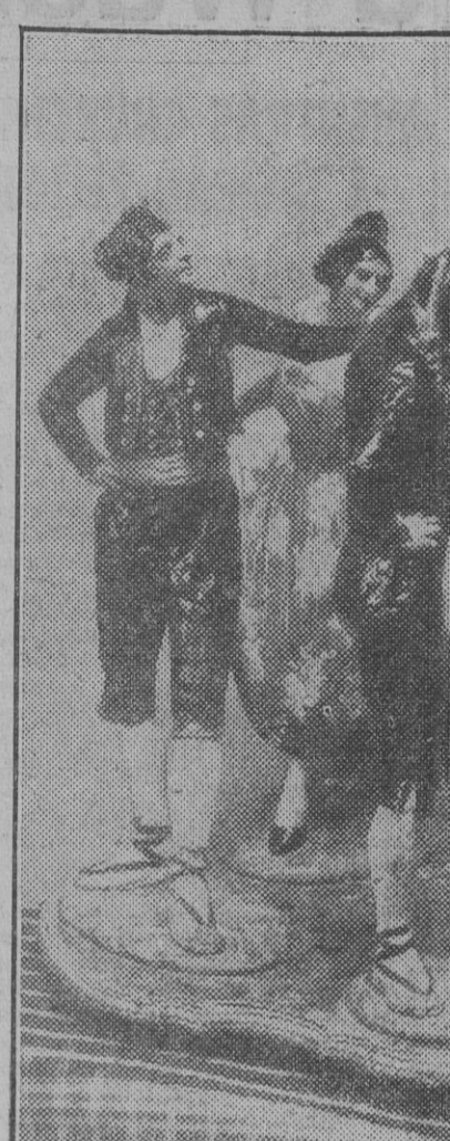
La "Xaquera vella", grupo cerámico del conocido artista Antonio Peyró, hecho en Valencia.