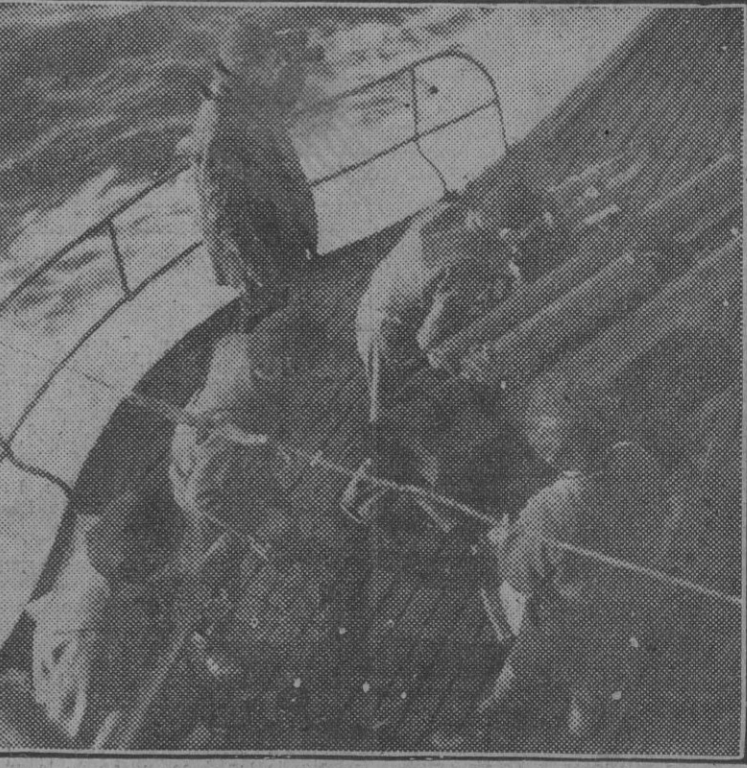
Un submarino italiano de servicio de guerra en el Atlántico se dispone a hacer fuego sobre un mercante enemigo capturado.