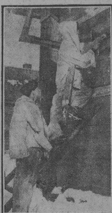
El personal de tierra de un aeródromo del Este fuerza su alojamiento para preservarse del crudo frío invernal.