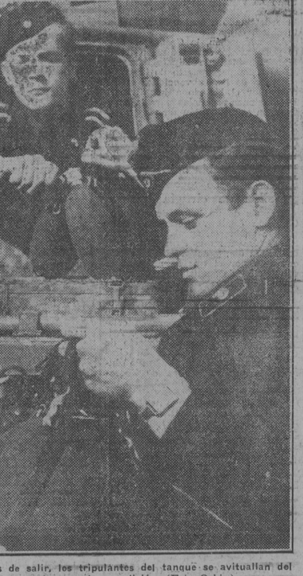
Momentos antes de salir, los tripulantes del tanque se avituallan del agua necesaria para la expedición.