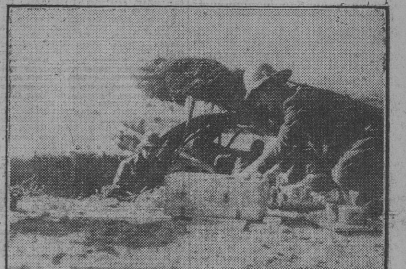
Una pieza de artillería italiana de pequeño calibre, entra en acción en uno de los sectores de África del Norte. (Foto Sánchez).