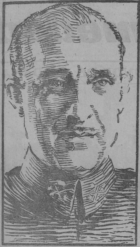
FIGURA DE ACTUALIDAD