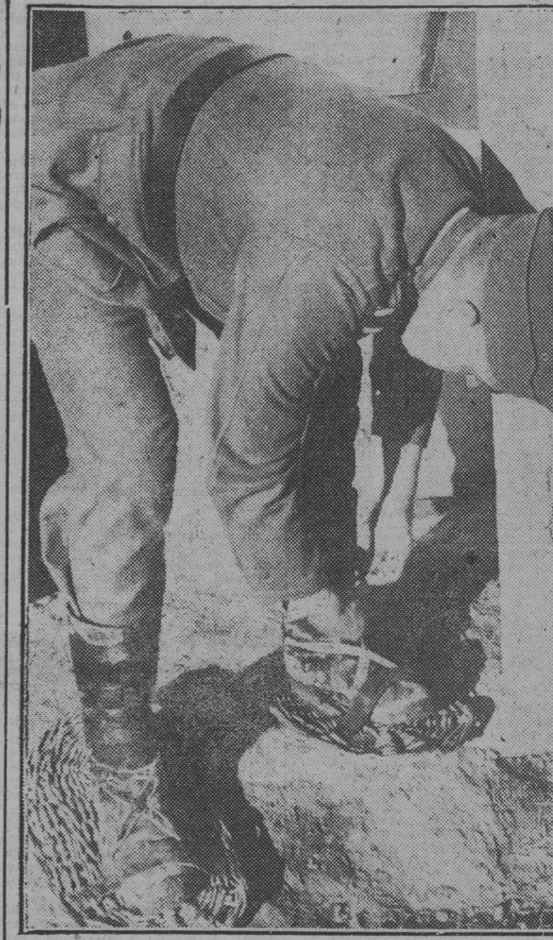
Los soldados alemanes en el Cáucaso se prueban unas rebajas especiales que les facilitan el paso sobre la nieve.