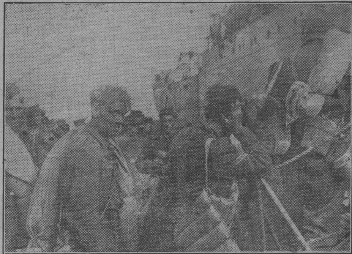
Soldados ingleses capturados por las tropas italianas en las últimas jornadas en África del Norte son transportados a la península. (Foto Sánchez).