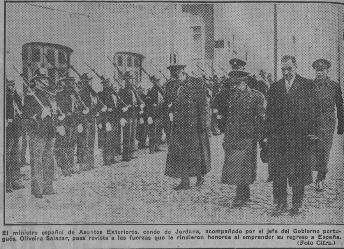
El ministro español de Asuntos Exteriores, conde de Jordana, acompañado por el jefe del Gobierno portugués, Oliveira Salazar, pasa revista a las fuerzas que le rindieron honores al emprender su regreso a España.