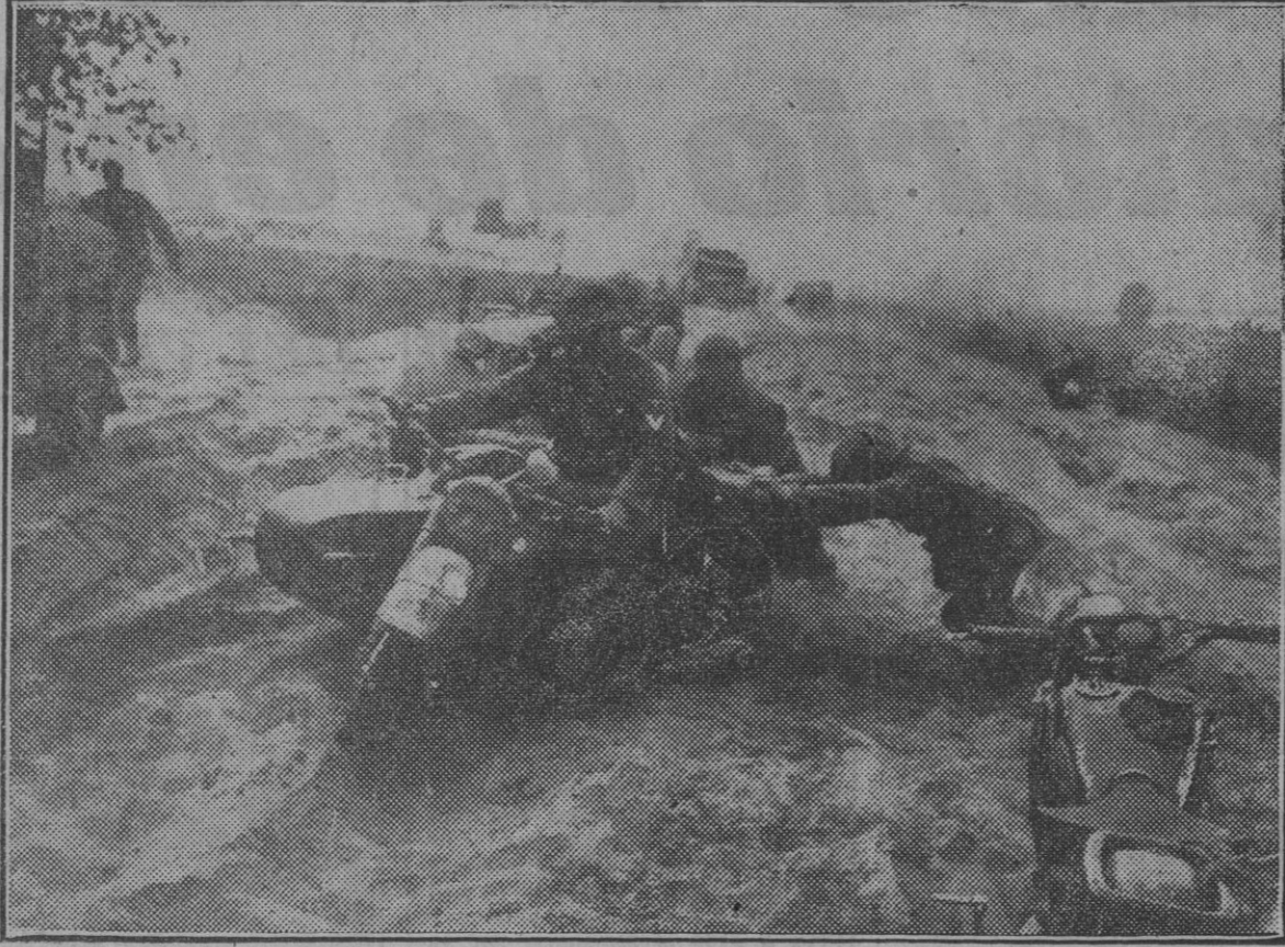
En el frente del Este no todo es barro y nieve ahora. En los sectores caucásicos todavía hay carreteras convertidas en verdaderos arenales, y por ellas avanzan las columnas motorizadas alemanas con las dificultades materiales que pueden apreciarse en este grabado.