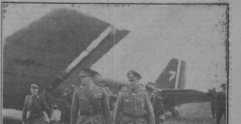
El Rey Miguel de Rumania llega a Crimea, al aeródromo de Sintepol, para inspeccionar a las fuerzas que guarnecen la península.