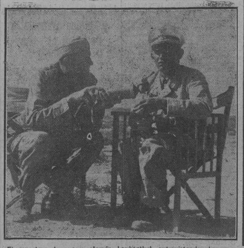
El reportero de guerra alemán Laubenthal, entrevistando al nuevo portador de la hoja de robe, general mayor Ramcke, que después de varios días cercado con su unidad, consiguió, en durísimos combates, incorporarse con sus tropas al grueso de las fuerzas.