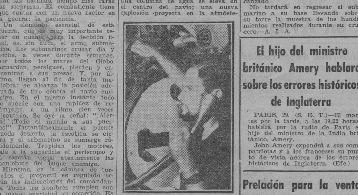
El comandante del submarino da las órdenes necesarias a la tripulación.

Ya desapareció la fase de "guerra relámpago" en la actual configuración. Hoy en día se prolongan las batallas, siendo más raras las sorpresas. El combate tiene que contar con un nuevo factor en la guerra: la paciencia. Un elemento esencial de esta guerra, que es muy importante tener en cuenta para la decisión final, es, sin duda, el arma submarina. Los submarinos cruzan día y noche, a veces durante semanas, por todos los mares del Globo. Aguardan, persiguen, pierden y encuentran a sus presas. Y, por último, llegan al fin de tanta maniobra: se alcanza la posición adecuada de tiro contra el navio enemigo. En el mismo instante todo se sucede con una rapidéz de relámpago a un ritmo cien veces ejecutado. Se oye la señal: "Alerta!" Todo el mundo a sus puestos!" Instantáneamente el puente queda desierto, la escotilla se cierra y el submarino se sumerge rápidamente. Trepidan los motores, sale a la superficie el periscopio y el capitán vigila atentamente las maniobras del buque enemigo. Mientras, en la cámara de torpedos el proyectil es regulado según las indicaciones del comandante. Todos los hombres cumplen con la mayor exactitud su cometido. Es necesario mantenerse exactamente sobre la ruta prescrita, y a la misma profundidad. La velocidad tiene que ser constantemente corregida. Junto al tubo acústico el marino encargado aguarda la orden de tiro. De pronto, el comandante ordena: "Tubo 1. ¡Fuego!". El torpedo parte como una centella. "Alcánzará al navío? El capitán y el