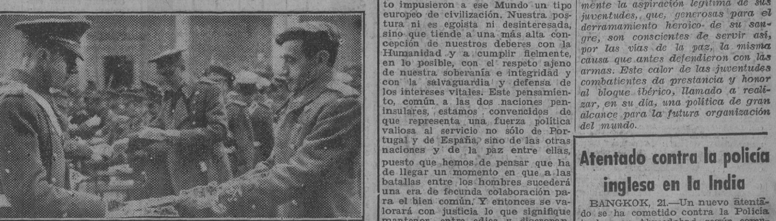
El teniente general Muñoz Grandes, jefe de la heroica División Azul, durante la entrega de despachos a los oficiales del ejército de tierra que han terminado sus estudios en las Academias Militares de Transformación, solemne acto celebrado hoy bajo la presidencia del Caudillo en las ruinas del glorioso Alcázar de Toledo.

Todos los mozos incluidos en el reemplazo de 1943 por el distrito de Hospital se presentaron en la Tenencia de Alcaldía, sita en la calle de la Cabeza, número 13, para hacerles entrega del pase de ingreso en Caja, en los días que a continuación se indica, y horas de diez a doce, por orden de apellidos: Letras A, B, C, D, día 22 de diciembre; E, F, G, 23; H, I, J, L, M, 24; N, O, P, Q, R, 25; S al final, 26.