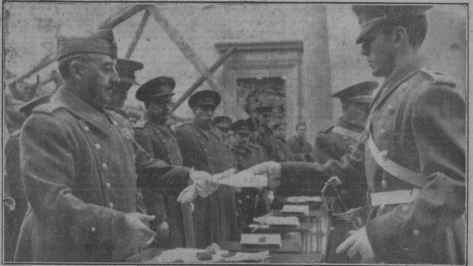
El Generalísimo de los Ejércitos de tierra, mar y aire en el momento de entregar los despachos a los nuevos oficiales, en el solemne acto celebrado esta mañana en el Alcázar de Toledo.

El mejor regalo de Navidad que podéis hacer a vuestros hijos es llevarlos a ver el maravilloso espectáculo de Pascua del Teatro Infantil "Lope de Rueda".