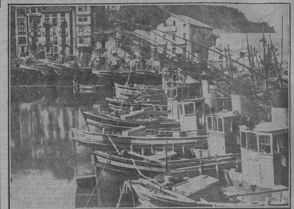
Las costas principales son las de la sardina, bonito, atún, el chicho, que llena estos días las despensas de toda España, como reservas para el invierno, y a precios verdaderamente populares; la palometa o japuta, aguja, anchoa o bocarte, verdal, besugo y otras especies.

En nuestras milenarias Cofradías de Pescadores los marineros pescaban en nombre de Dios y bajo el amparo de las bulas pontificias, y en esas Cofradías se forjaron los hombres de temple de acero, fuertes de alma y de cuerpo, que enseñaron a pescar al Mundo, antecesores de estos otros hombres que hoy tripulan las treinta mil embarcaciones que hoy se dedican en Es-