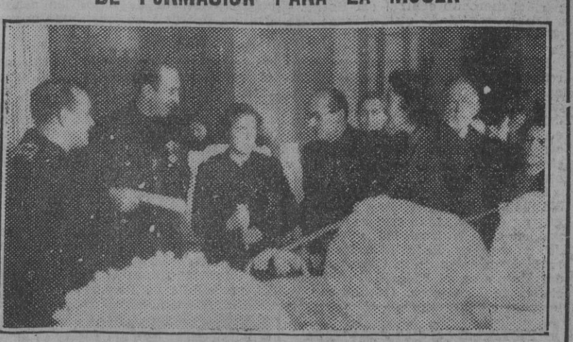
El ministro de Educación Nacional, camarada Ibañez Martín; el vicepresidente general del Movimiento, camarada Mora Figueiras; la delegada nacional, camarada Pilar Primo de Rivera, y otras jerarquías, durante el acto de clausura de la segunda parte del plan formativo de la mujer organizado por la Sección Femenina.