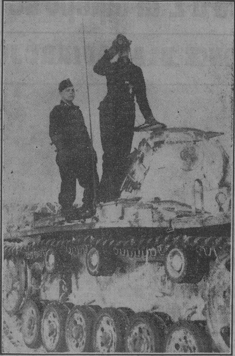
El soldado más alto y el más bajo de una compañía blindada alemana. La diferencia de estatura es muy grande; pero el coraje y el corazón puestos en la lucha son iguales.