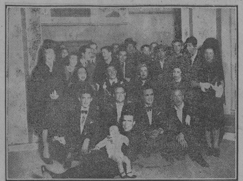
El cuadro artístico de Educación y Descanso de Córdoba, que actuó en el festival celebrado recientemente en honor de las familias de los productores con motivo de las próximas fiestas de Pascua.