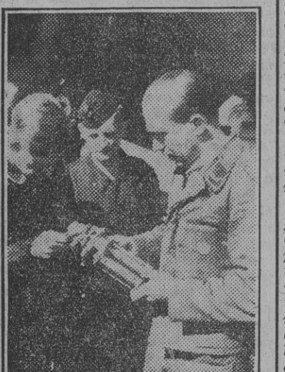
El profesor da una clase práctica a los aprendices de mecánicos sobre el funcionamiento y ajuste de las piezas de un motor de aviación.