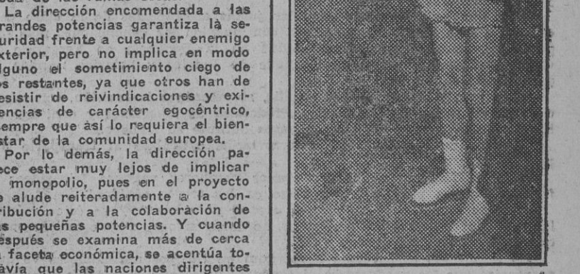
Los soldados alemanes muestran su entusiasmo por las "estrellas" en sus breves días de permiso después de los duros combates en el Este. He aquí a la patinadora húngara Giorgyi firmando autógrafos en el Palacio del Hielo de Viena acordada por un grupo de admiradores. (Foto Transocean).