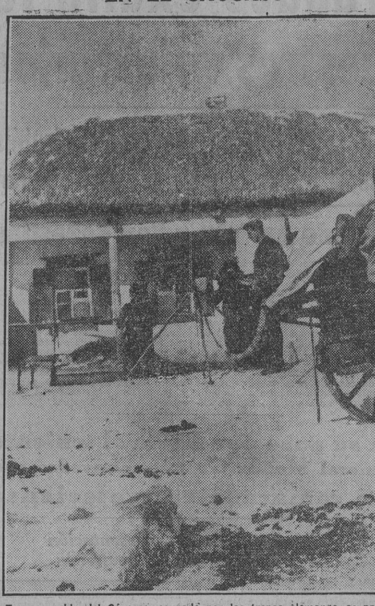
En un pueblo del Cáucaso, ocupado por las tropas alemanas, se procede a instalar ametralladoras antiáreas para defenderse contra los ataques aéreos de los Soviets. (Foto Iberia).