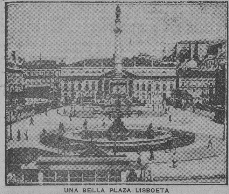
UNA BELLA PLAZA LISBOETA