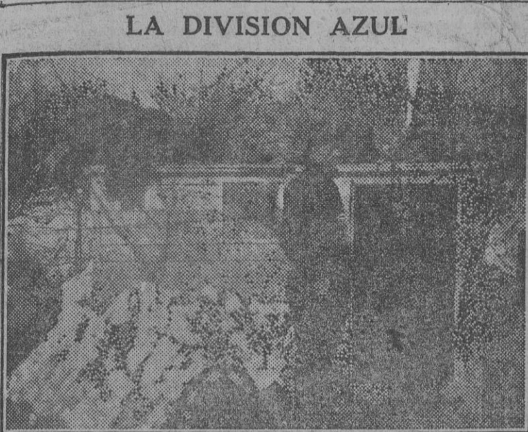
Un puesto de transmisiones de la heroica División Azul en el frente de Rusia. Nuevamente han comenzado los hielos y nuestros soldados tienen que luchar contra un nuevo enemigo. (Foto Orbis).