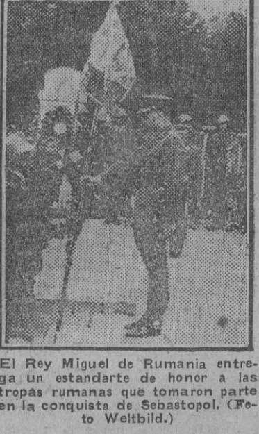
El Rey Miguel de Rumania entrega un estandarte de honor a las tropas rumanas que tomaron parte en la conquista de Sebastopol.

ROMA, 2. (S. E. T.).—Se ha comprobado en el frente oriental la eficacia absoluta de los equipos de invierno de la aviación italiana. Los aparatos italianos han participado en las operaciones en los últimos días con estos equipos especiales. Incluso en las temperaturas de 25 grados bajo cero, los aviones italianos realizan vuelos completamente normales. Cada aparato está provisto de estufas especiales para calentar los depósitos de esencia y de agua, además de unos dispositivos para evitar la congelación. Asimismo los aparatos para conducir agua caliente a los motores funcionan a la perfección. Se trata de patentes italianas que ya en los primeros ensayos dieron un resultado excelente. Las informaciones del frente revelan que ha causado gran sorpresa entre los Soviets el hecho de que los aviones italianos hayan actuado normalmente incluso con las temperaturas más bajas. En el invierno pasado, por el contrario, los aviones sólo pudieron despegar después de largos preparativos. Este año pueden elevar el vuelo en pocos minutos. También la intervención de los bombarderos italianos ha sorprendido a los bolcheviques, ya que éstos no esperaban la actividad aérea tan intensa en pleno invierno y no habían tomado las usuales medidas de precaución. (Efe.)