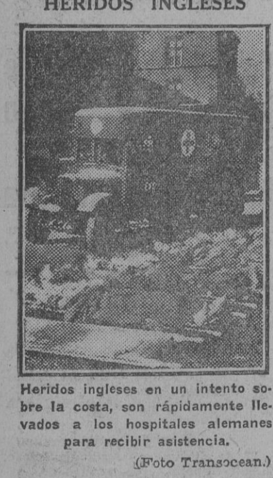
Heridos ingleses en un intento sobre la costa, son rápidamente llevados a los hospitales alemanes para recibir asistencia.