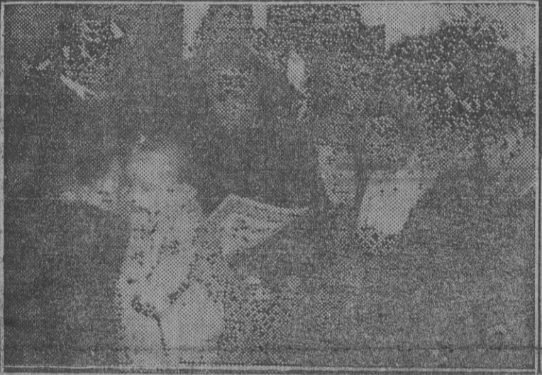
El ministro de la Gobernación, camarada Blas Pérez, durante la inauguración del nuevo Dispensario de Maternología e Higiene Infantil, acto celebrado en la mañana de hoy.