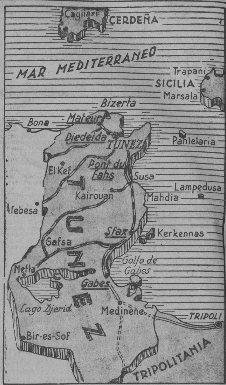
Las noticias de Tunes parecen indicar que ahora es cuando empieza en serio la batalla. Los comunicados del Eje anuncian la entrada en contacto de las tropas angloamericanas, reforzadas, con las fuerzas de protección germanoitalianas...