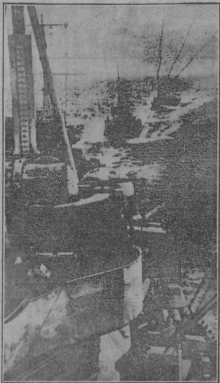
Una flotilla de destructores y torpederos en servicio de patrulla por el mar polar.