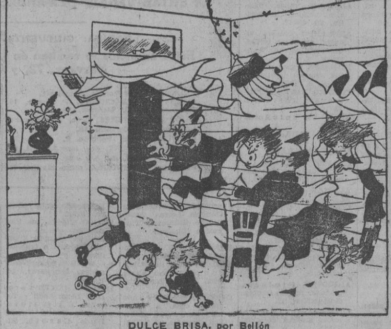
DULCE BRISA, por Bellón. —¿Qué mérito de mi mujer de dejarse abierta la puerta de la cocina mientras hace buñuelos de viento!

GRAN CUARTEL GENERAL DEL FUHRER, 3.—Comunicado del Alto Mando de las fuerzas armadas alemanas: "Un grupo de submarinos alemanes que operan frente a la costa canadiense, a pesar de las desfavorables condiciones atmosféricas, ha conseguido entrar en contacto con un convoy que, cargado de material de guerra y de víveres, se dirigía a Inglaterra. A consecuencia de una serie de encarnizados ataques, realizados en el curso de varios días y noches, dieciséis barcos, con un total de 94.000 toneladas, han sido hundidos. Tres de estos barcos, con cargamento de municiones, hicieron explosión al ser alcanzados por el primer disparo. Además, dos buques, con un desplazamiento global de 12.000 toneladas un destructor y una corbeta han sido torpedeados. Únicamente los dispersos restos del convoy han podido escapar entre la niebla." (Efa.)