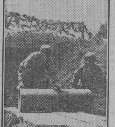
Las baterías de largo alcance empleadas por los alemanes en la costa del Canal de la Mancha emplean enormes proyectiles, cuyos cartuchos tienen las dimensiones y el volumen que se aprecian en este grabado.