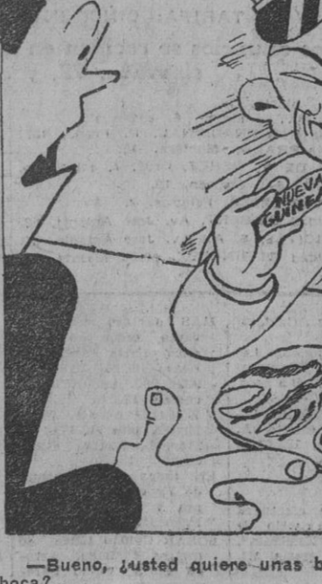
—Bueno, ¿usted quiere unas bocas de la leña o unas "leña" de las bocas? (Efe.)