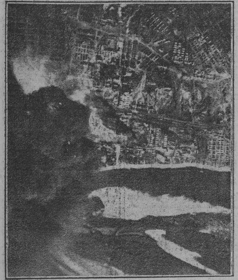
La aviación germana no cesa un solo momento en su constante y terrible martirio sobre la ciudad que lleva por nombre del dictador rojo. La foto reproduce el casco urbano de Stalingrado bajo los efectos destructores de las bombas que inexorablemente dejan caer los bombarderos alemanes. (E. W.)

Las hacen saltar obras fortificadas de esta plaza fuerte que los Soviets defienden al precio de numerosas víctimas. Las líneas de combate alemanas se aproximan ahora hasta los límites inmediatos de esta ciudad, cuya longitud es de 20 kilómetros. La jornada de hoy está destinada a lograr que las tropas alemanas penetren su primera entrada en los barrios interiores de la ciudad. Se trata de apoderarse de una fábrica cuyos muros gruesos y muros altos desde un bosque de pinos muy pesados. Algunas trincheras separan aún a los combatientes de las carreteras de Stalingrado. Pero ellas no pueden superar una dificultad, y esperamos a que lleguen los Stukas.