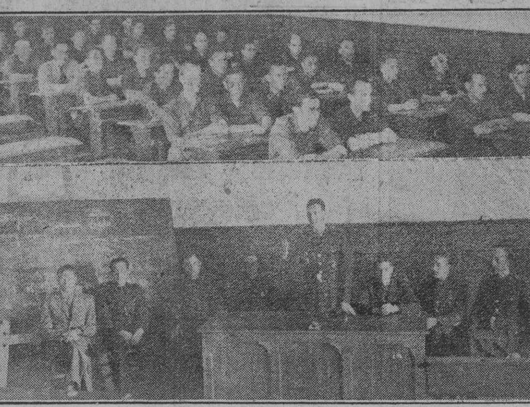
Los asistentes al curso de instructores para maestros del Frente de Juventudes escuchan las consignas que han de servir para educar a las nuevas generaciones.