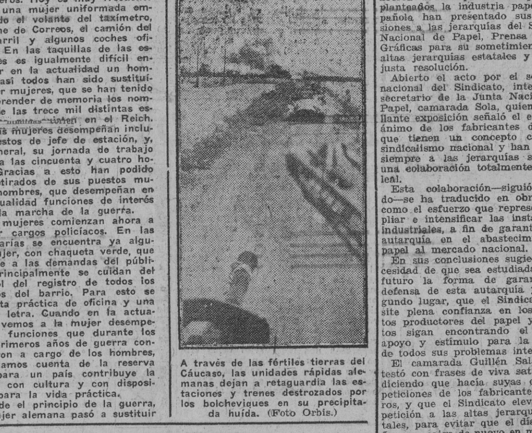
A través de las fértiles tierras del Cáucaso, las unidades rápidas alemanas dejan a retaguardia las escombros de trenes destruidos por los bolcheviques en su precipitada huida.