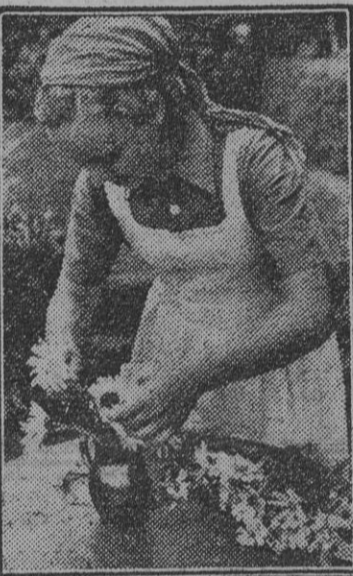
El amor a las flores, aspirar su aroma, convertir las en alpino propio y del hogar, son el anhelo de las pequeñas camaradas. Esta margarita alemana ha cortado ella misma, con gran dolor, y las va estas homónimas suyas y las va colocando con gran mimo en un frágil jarrón que pronto alegrará algún mueble de sus habitaciones.