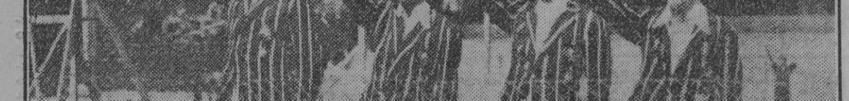
El equipo español que en los últimos días de la pasada semana logró en Vigo un éxito al triunfar del grupo seleccionado de Portugal.