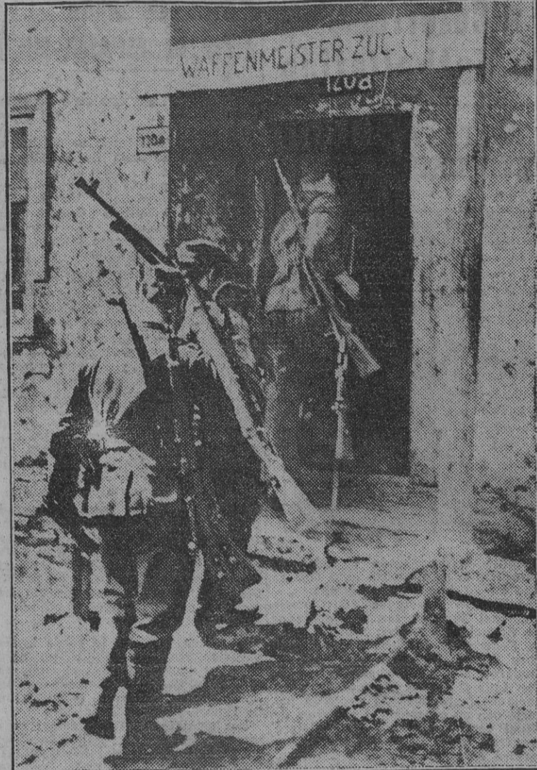
Aprovechando los períodos de calma los soldados alemanes llevan sus fusiles al armero de sus unidades respectivas para someterlos a un buen repaso que los mantenga en perfecto estado.