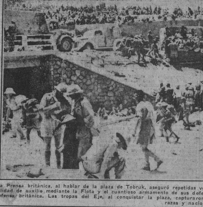
La Prensa británica, al hablar de la plaza de Tobruk, aseguró repetidas veces que la fortaleza era inexpugnable. Sus sólidas defensas, la posibilidad de auxilio mediante la Flota y el cuantioso armamento de sus defensores hacían de la ciudadela uno de los más sólidos bastiones de la defensa británica. Las tropas del Eje, al conquistar la plaza, capturaron copioso botín de guerra y gran cantidad de prisioneros de todas las razas y nacionalidades.