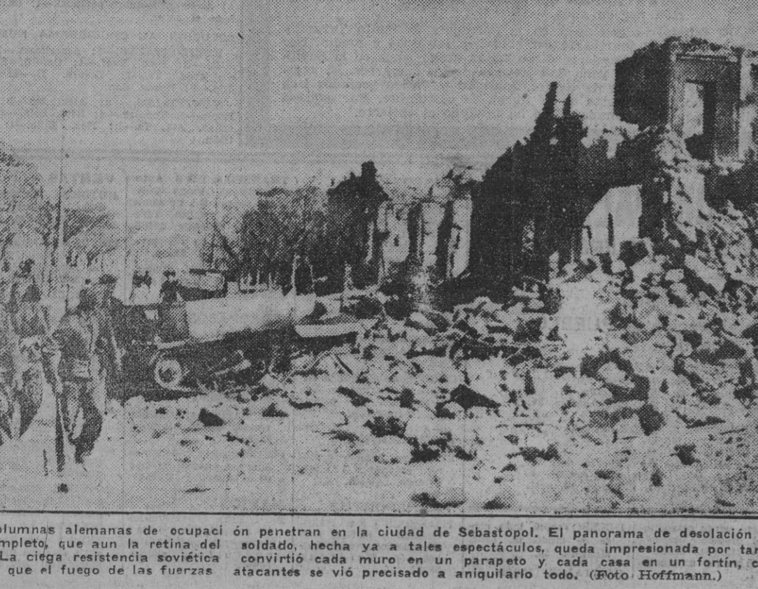
Las columnas alemanas de ocupación penetran en la ciudad de Sebastopol. El panorama de desolación es tan completo, que aun la retina del soldado, hecha ya a tales espectáculos, se impresionada por tanta ruina. La ciega resistencia soviética convirtió cada muro en un parapeto y cada casa en un fortín, con lo que el fuego de las fuerzas atacantes se vio precisado a aniquilarlo todo.