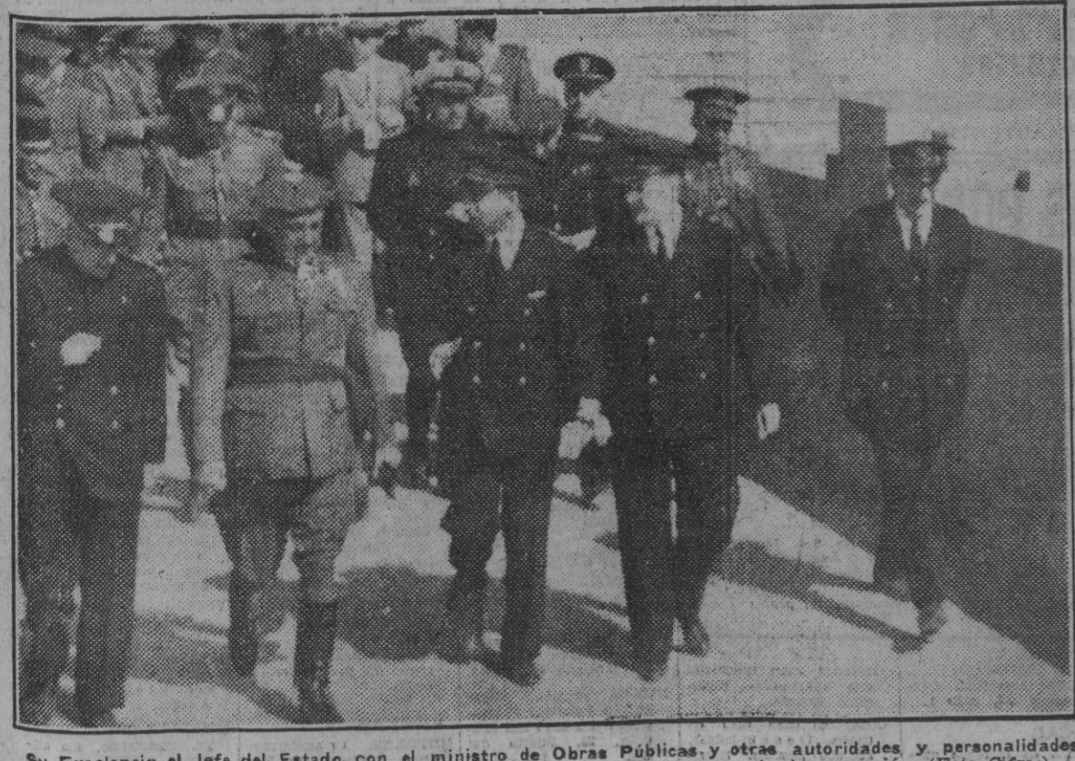
Su Excelencia el Jefe del Estado, con el ministro de Obras Públicas y otras autoridades y personalidades, durante su visita al pantano de San Bartolomé en el solemne acto de inauguración.