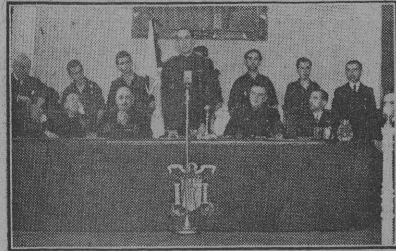
El subsecretario de Agricultura en el momento de dar por clausurada la primera Asamblea de presidentes de Colegios Veterinarios.