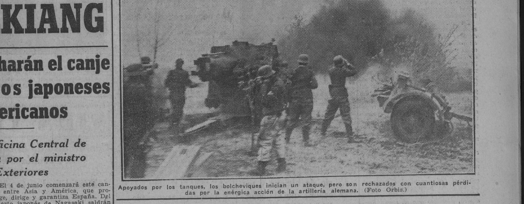
Apoiados por los tanques, los bolcheviques inician un ataque, pero son rechazados con cuantiosas pérdidas por la enérgica acción de la artillería alemana.