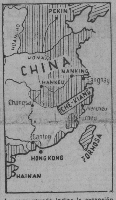
La zona rayada indica la extensión del avance japonés, que ahora quiere su mayor intensidad en la región de Chekiang. La operación es de tal envergadura que supone la concentración de toda actividad del ejército de Chungking.

Allocución del mariscal chino. El mariscal Chan-Kai-Chek ha pronunciado un discurso ante el microfono, discurso que ha sido pronunciado especialmente para Norteamérica. El generalísimo chino solicitó apoyo material de los Estados Unidos y afirmó que si China recibe un 10 por 100 de la producción militar norteamericana devolverá tales entregas con beneficios centuplicados para la causa aliada. Expresó su confianza en la aplicación de los principios consignados en la Carta del Atlántico y puso de relieve que el valor de estos resortes humanos se agota en un momento cuando se hace un esfuerzo mental y se piensa lo que sería de nosotros si no los poseyéramos en tanta abundancia.