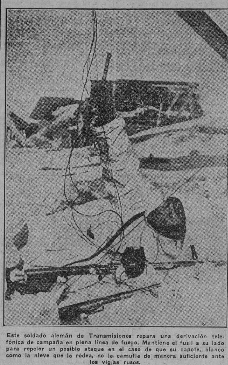
Este soldado alemán de Transmisiones repara una derivación telefónica de campaña en plena línea de fuego...