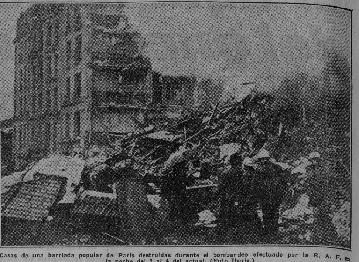
Casas de una barriada popular de París destruidas durante el bombardeo efectuado por la R. A. F. la noche del 3 al 4 del actual.