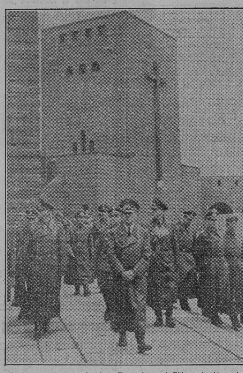
En el monumento nacional de Tannenberg, el Führer de Alemania rinde homenaje a los héroes caídos en la Gran Guerra y en lo que va de la actual.

BERLIN, 15.—Se ha celebrado una solemne ceremonia militar en el Museo del Ejército con ocasión de la conmemoración de los soldados alemanes caídos en la Gran Guerra y en el curso de la guerra actual. El Führer pronunció unas palabras de reconocimiento a los sacrificios de estos héroes.