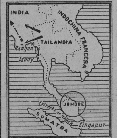
El grupo de ejércitos japoneses que avanza hacia Moulmein, según las últimas noticias, han derrotado tras encarnizados combates a los 40.000 ingleses que defendían aquel frente. La ocupación de importantes puntos de la costa birmana facilita a los japoneses la iniciación de violentas acciones sobre Rangún y acciones navales en el Golfo de Bengala. De esta forma no sólo se cierra una grave amenaza sobre la India, sino que Chungking verá cortadas todas sus comunicaciones con sus aliados.

SHANGHAI, 22.—Según informaciones de procedencia británica, llegadas de Rangún, los japoneses inician, después de la conquista de Tavoy, una ofensiva contra Birmania, basada en un segundo punto sobre Moulmein, al borde de la bahía de Martaban, hacia el suroeste de Rangún. Esta operación tiene como fin desgajar de Birmania otra amplia zona de territorio de una anchura de 250 kilómetros. Los nipones han atravesado la frontera por varios puntos, y según las mismas informaciones, japoneses y tailandeses combaten unidos. Un comunicado oficial fechado en Rangún admite que las fuerzas niponas son superiores en número y tienen las ventajas del relieve del terreno, ya que avanzan desde la meseta tailandesa hacia las llanuras birmanas. (Efe.)