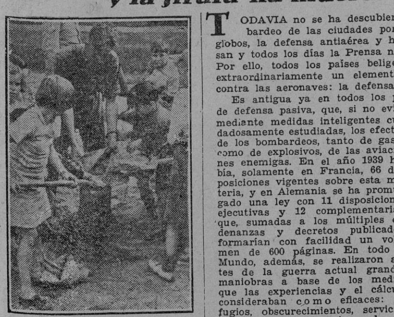
Los niños londinenses ayudan a llenar sacos de arena a los voluntarios de la defensa pasiva.

TODAVIA no se ha descubierto un medio eficaz que impida el bombardeo de las ciudades por la aviación enemiga. Las barreras de globos, la defensa anti-aérea y hasta la aviación de caza propia fracasan y todos los días la Prensa nos da las noticias de ciudades atacadas. Por ello, todos los países beligerantes, o los que temen serlo, cuidan extraordinariamente un elemento de capital importancia en la lucha contra las aeronaves: la defensa pasiva. Es antigua ya en todos los países la preocupación por las medidas de defensa pasiva, que, si no evita el ataque enemigo, reduce al menos, mediante medidas inteligentes y cuidadosamente estudiadas, los efectos de los bombardeos, tanto de gases como de explosivos, de las aviaciones enemigas. En el año 1939 había, solamente en Francia, 66 disposiciones vigentes sobre esta materia, y en Alemania se ha promulgado una ley con 11 disposiciones ejecutivas y 12 complementarias, que, sumadas a los múltiples ordenanzas y decretos publicados, formarían con facilidad un volumen de 600 páginas. En todo el mundo, además, se realizaron antes de la guerra actual grandes manobras a base de los medios que las experiencias y el cálculo consideraban como eficaces: refugios, obstrucciones, servicios de incendios y consejos a la población civil. (Continúa en 4.ª página.)