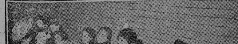
La vida en los refugios no es muy confortable, pero es obligada cuando, como ha ocurrido en Londres, los ataques aéreos son constantes y violentísimos. (Foto Cifra.)

Las letras de "Prisioneros de guerra", con 250 bidones de gasolina. Para evitar los daños de bombardeos ingleses sobre sus propios soldados. ESTOCOLMO, 22.—El diario sueco "Dagens Nyheter" publica una información sobre el trato dado por los alemanes a los prisioneros de guerra británicos que se encuentran en el destierro de Halafaya. A petición de los referidos prisioneros, el oficial del campo de concentración distribuyó docientos bidones de gasolina, para con ellos componer la frase "Prisioneros de guerra", que, vista desde el aire, evitara los intensos bombardeos que la aviación inglesa realizaba contra las posiciones alemanas, castigando de tal modo incluso a los prisioneros ingleses. Por otra parte, los prisioneros ingleses declaran que los médicos alemanes se veían en difícil situación al no poder disponer de agua en las sitiadas posiciones del destierro de Halafaya para limpiar las heridas de los soldados. (Efe.)