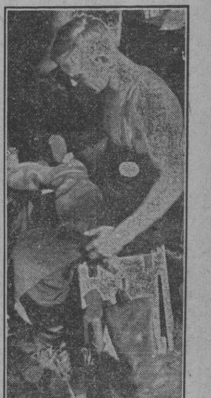
Operarios especializados, en el mismo fr nte, proceden al arreglo del calzado de los soldados alemanes en servicio organizado por la Intendencia mediante compañías de zapateros.