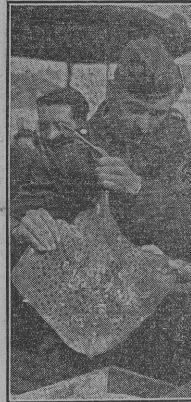
Estos soldados alemanes de ocupación en Francia dedican sus ocios a la pesca, con el buen resultado que revela la fotografía presente.