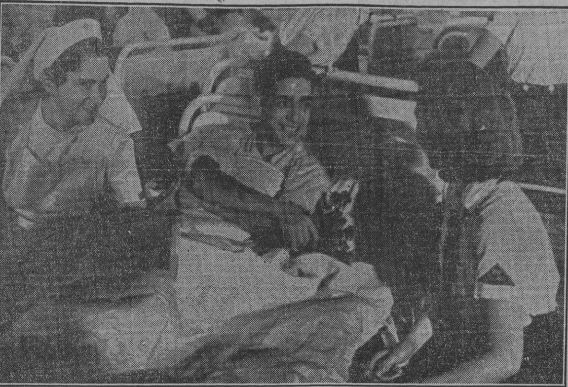
Un ambiente de cálida simpatía acompaña a la División Azul. La fotografía ha sido obtenida durante una visita de las Juventudes Feministas de Berlín a un hospital de convalecientes españoles, a los que obsequiaron con dulces y flores.