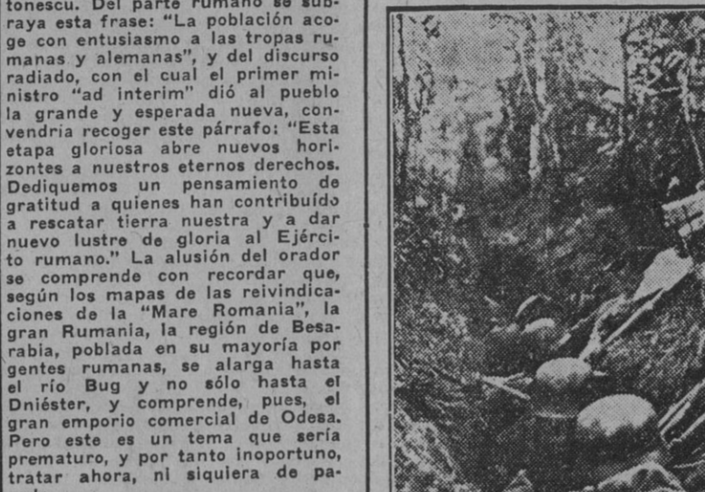
Tropas alemanas preparadas en una trinchera provisional esperan la orden de asalto.