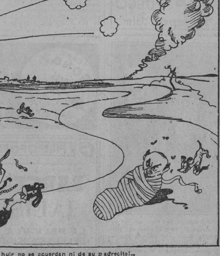
LENIN.—¡Corcholis! ¡Que a la hora de huir no se acuerdan ni de su padrecito!