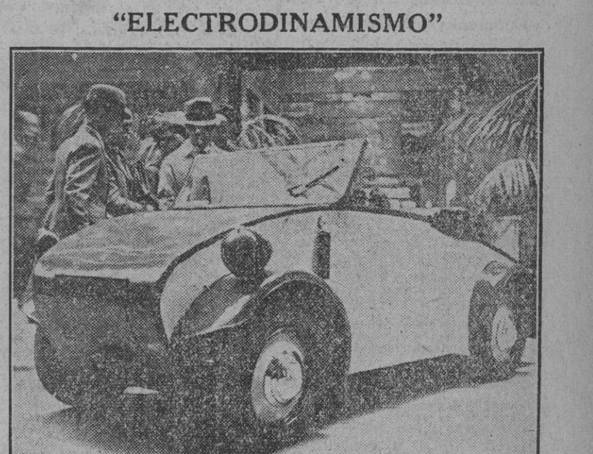
Este será el nuevo vocablo en el argot de los automovilistas en las ferias de coches. He aquí un modelo exhibido en Lyon durante un certamen recientemente verificado.

BUCAREST, 18. (S. E. T.).—El periódico "Ordinea" informa que Stalin ha nombrado "Generala de Ejército" a la comunista rumanojudía Ana Pauker.