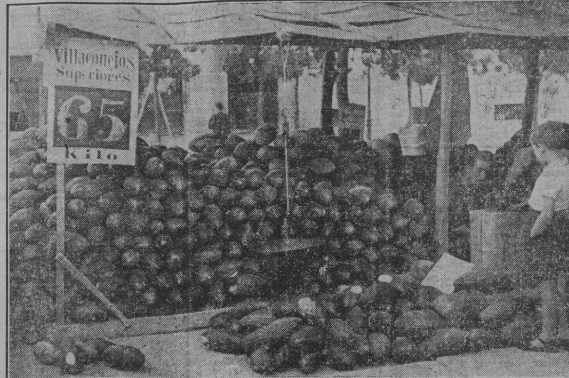
En cada escuela madrileña se levanta hoy una barricada. Saturado el ambiente del belicismo que los periódicos sugieren con sus noticias de guerra, se nos antojan depósitos de obuses. Pero no pasan de ser municiones de Villacabras. El sábralo 'cucurbita melo', delicioso manjar español, que nada tiene que envidiar a las más ricas frutas tropicales. Pero, ¡caudales!, que si por la mañana es oro y por la tarde plata... por la noche mata. Como si, en efecto, fuese un obús.