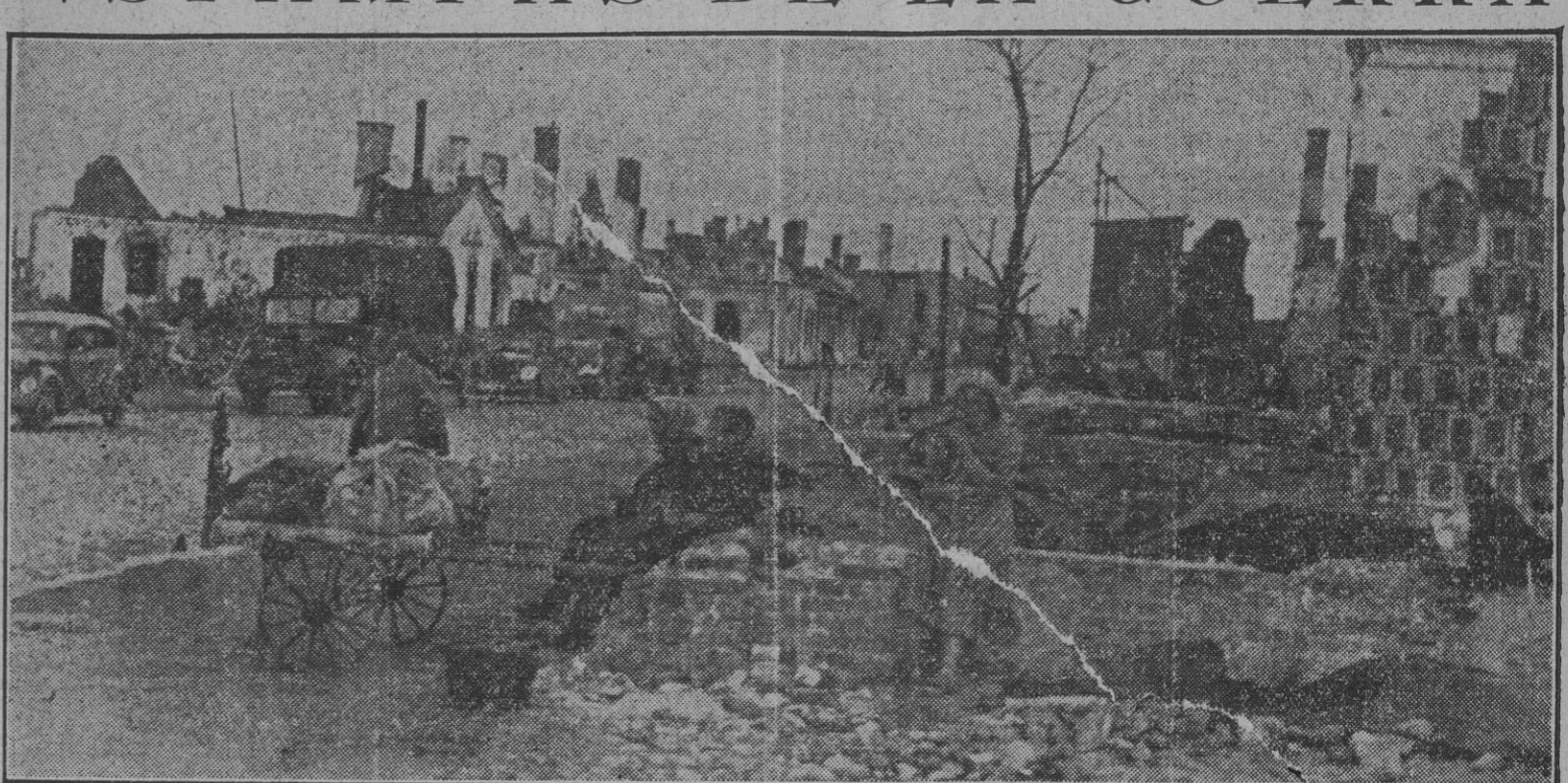
Familias sin hogar, esqueletos de casas, mugre, piojos... éste es el rastro de la horda roja en la ciudad que obligaron a una resistencia estéril y cruel, a pesar de las humanitarias advertencias de las tropas atacantes. "Quedaos en la miseria", dice Stalin, cómodamente instalado en el Kremlin, mientras los engañados arrastran por los escombros su amargura, su desengaño y su miseria.