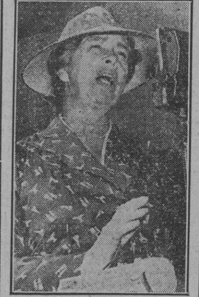
La señora de Roosevelt, ante el microfono, después de haber sido investida por el alcalde de Nueva York, Fiorello La Guardia, con el título de vicedirectora de la defensa civil. En esta ceremonia el alcalde neoyorquino proclamó a la señora de Roosevelt "voluntaria número 1".