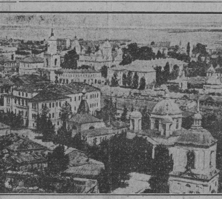
VISTA PARCIAL DE LA CIUDAD DE KIEV