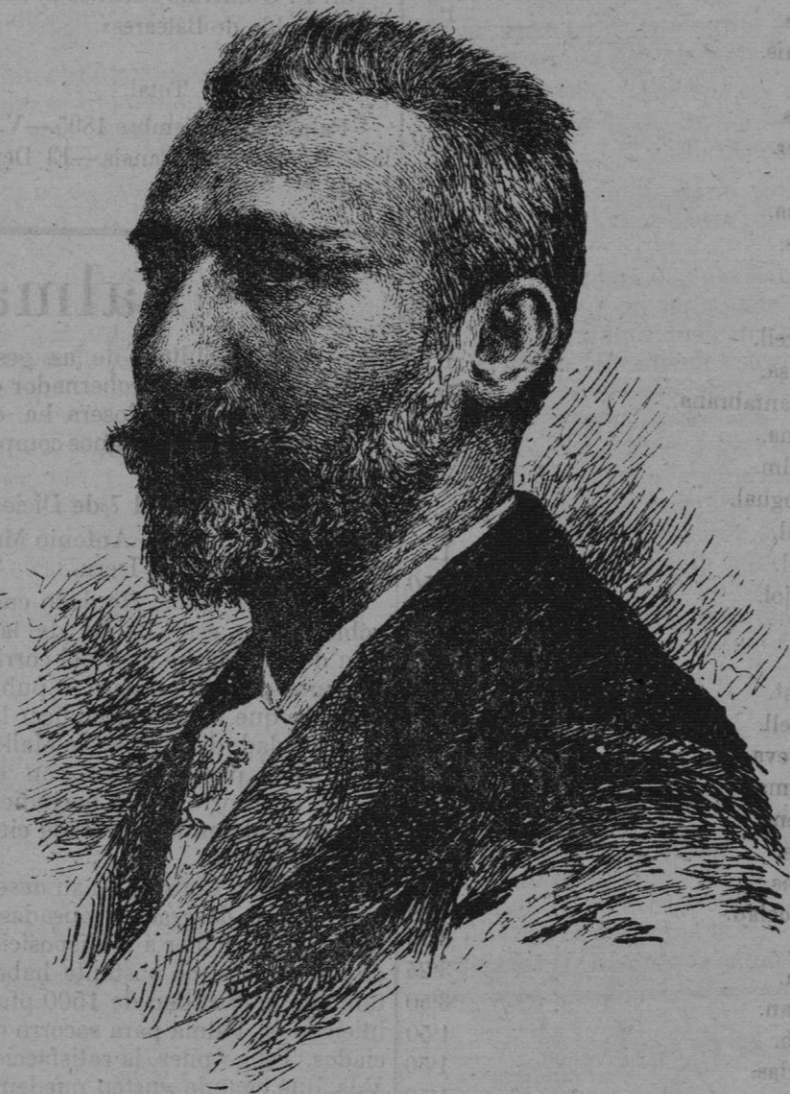
Excmo. Sr. D. Antonio Maura y Montaner

«Pero tus manos son los funcionarios que tú has elegido; tus manos son las personas de quienes te has valido para todo; tus manos son la cohorte de amigos, peor que cien cohortes de esclavos fugitivos, que llevaste contigo á Sicilia: esas son tus manos.» Tú dices que no has recibido el dinero, pero yo no puedo admitir otra cosa que tu responsabilidad; no puedo admitir la exculpación que intentas, que si se admitiese una vez, haría imposibles las causas de concusión en adelante.»