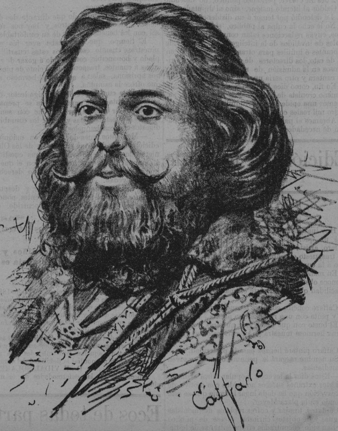
Dmitri Slaviansky D'Agrenoff

Y lo más singular del caso es que los mismos que se apropiaron el proyecto de reformas siguen combatiendo sin piedad al Sr. Maura, y así como