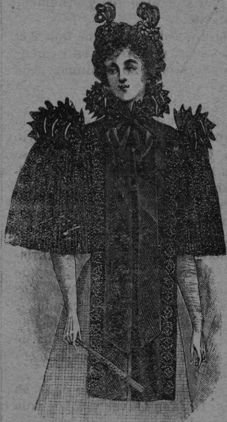
NOVEDADES PARA SEÑORA Recibidas de Paris

Recibidos los géneros de la Estación se expendrán con NOTABLE BARATURA