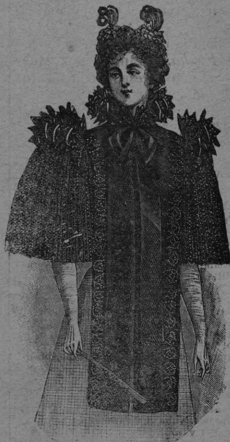
NOVEDADES PARA SEÑORA

Recibidos los géneros de la Estación se expenderán con NOTABLE BARATURA