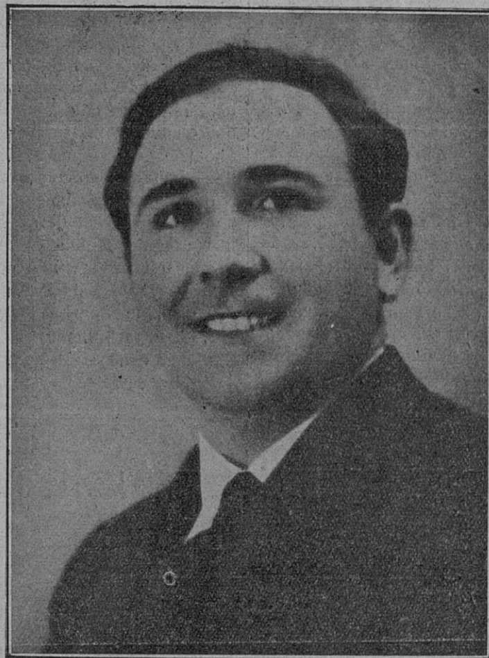
Nuestro paisano el celebrado barítono Antonio Truyols, que mañana actuará en el Teatro Príncipe I.

Especialidad en ampliaciones. Precios económicos.