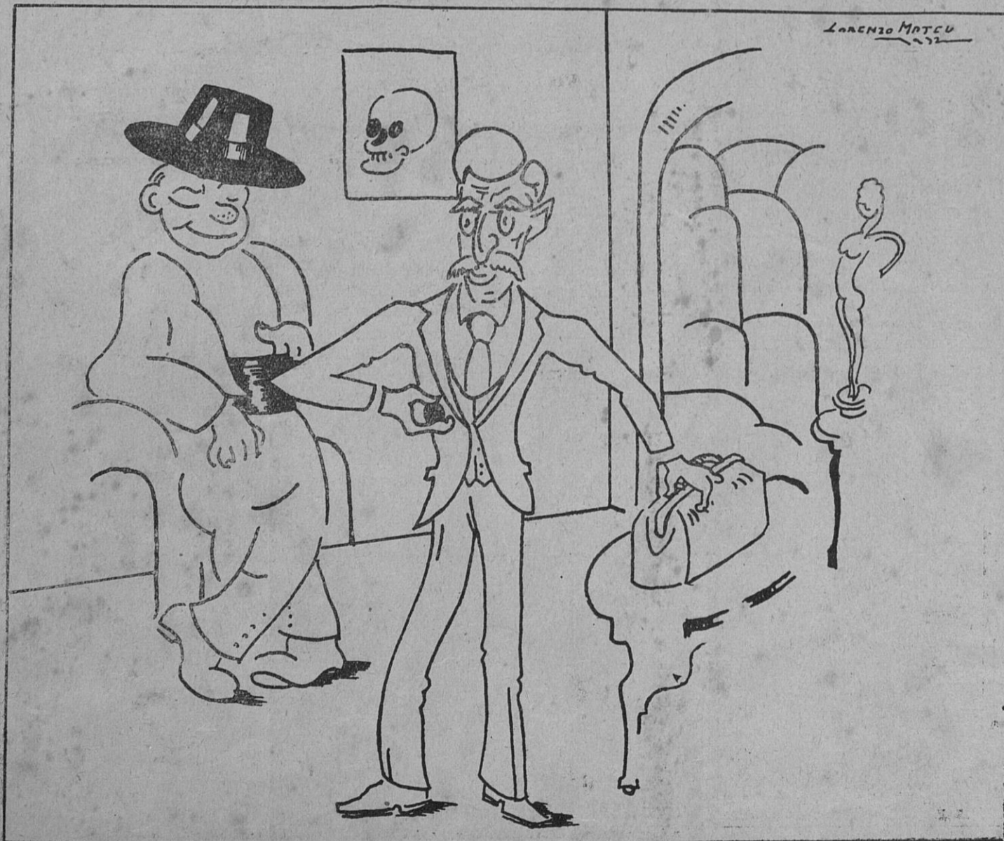
EN LA CONSULTA - por L. Mateu

En cuanto a la presentación de nuestro periódico, no cabe duda que es modesta como modestos son también nuestros me-