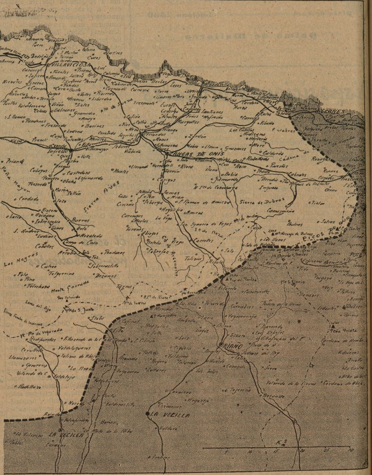
En este gráfico de la zona oriental de Asturias puede verse (la zona punteada) el avance conseguido por nuestras valientes tropas y milicias hasta el jueves de esta semana. La semana próxima publicaremos el gráfico de la zona occidental de Asturias para que nuestros lectores puedan seguir la marcha de las operaciones. De Aragón no ha habido para qué hacer gráfico, pues apesar de los grandes esfuerzos de los rojos, la línea de combate no ha sufrido variación.