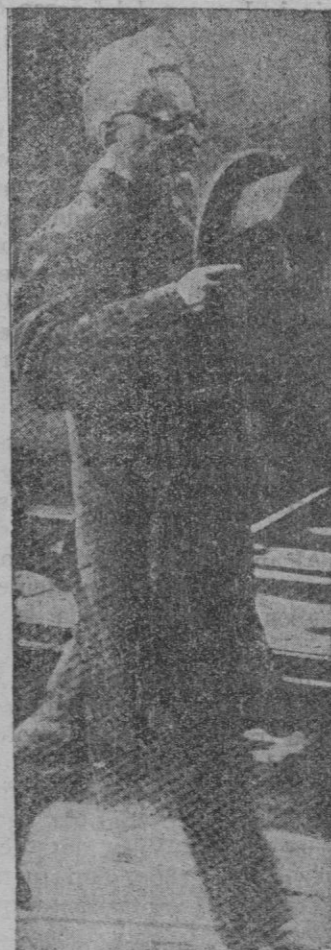
Leon Trotsky al llegar a la estación de Lyon de paso para Dinamarca