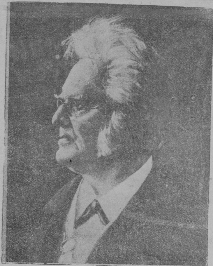
Estocolmo.—Retrato pintado por Egolf Soot, del gran literato sueco Bjornstjerne Bjornson, el centenario de cuyo nacimiento se ha celebrado recientemente.