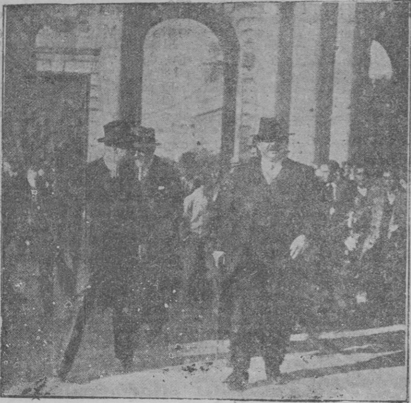
El jefe del Gobierno francés dirigiéndose al Retiro, a pie, seguido de numeroso público, poco después de su llegada a Madrid

Las representaciones del «Tenorio» han sido siempre fecundas en incidentes pintorescos. Cada año florecen hasta en la misma Mallorca. De hoy en adelante: La compañía llegó al pueblo para representar el Tenorio, pero por ocupaciones ineludibles quedó en Palma la primera actriz que debía hacer el viaje en el tren de la noche que tiene su llegada a hora que se consideraba oportuna, ya que como se sabe doña Inés no aparece en escena hasta el tercer acto.