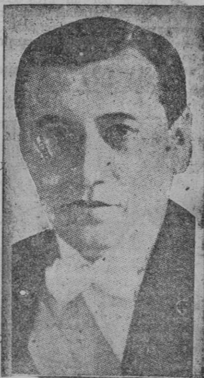
En las elecciones presidenciales ha sido elegido por gran mayoría el ex-presidente Arturo Alessandri

y para formularla, de su puño y letra entregó a sus edecanes la siguiente lista: