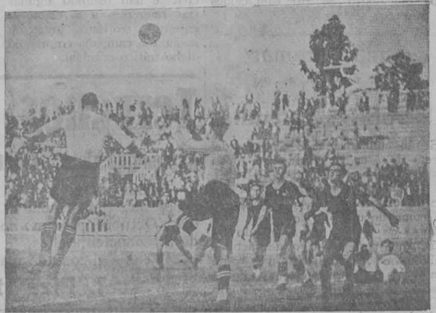
Un momento del partido celebrado en Barcelona el sábado último, entre catalanes y mallorquines.