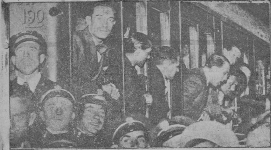
Los deportados en el tren despidiéndose de sus familias